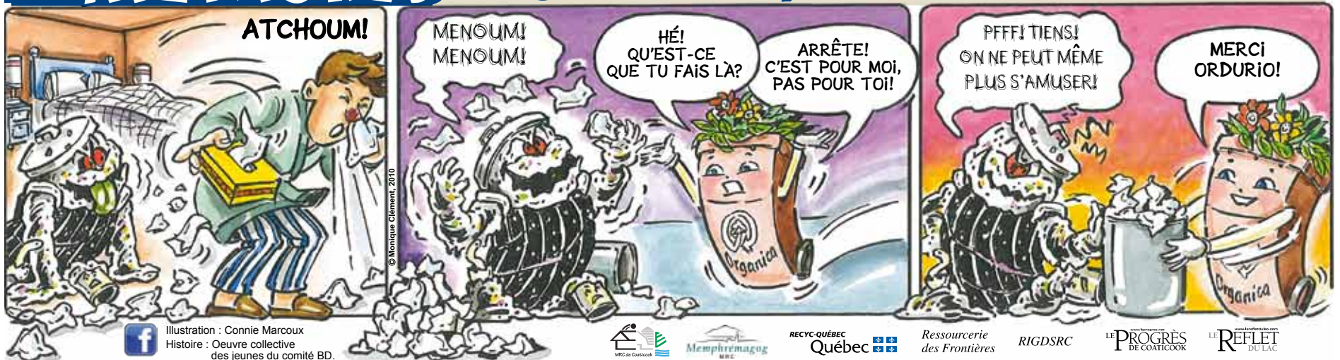
Illustration : Connie Marcoux Histoire : Oeuvre collective des jeunes du comité BD.

Les mouchoirs souillés doivent être compostés.