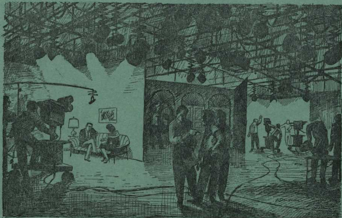
Rehearsal in Studio 'D', CFCM-TV and CKMI-TV, Québec