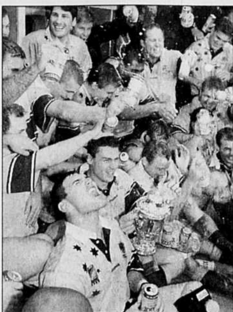
Les All Blacks doivent cette victoire à leur technique irréprochable et leur cœur infatigable.

Mais cette fois-ci, pour qui aime ce jeu, il faut beaucoup de consolation. Que les Australiens gagnent n'a rien de scandaleux, ne serait-ce que pour leurs beaux joueurs, d'une technique irréprochable et d'un cœur infatigable. Qu'ils aillent d'un bout à l'autre de la compétition sans varier d'un pouce, reproduisant six fois le même match ou quasiment, a quelque chose de désolant. Ils ont trouvé un système, le plus efficace en 1999, basé sur une défense rigoureusement pensée dans tous ses détails: jeu à la main impossible, pénétration en force inutile, jeu au pied hasardeux. Dans le fonctionnement du