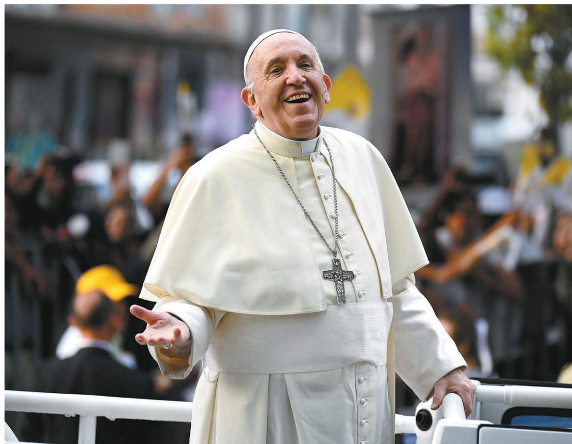
Lors de son voyage au Chili, le pape François a commis l'une des pires gaffes de sa papauté.