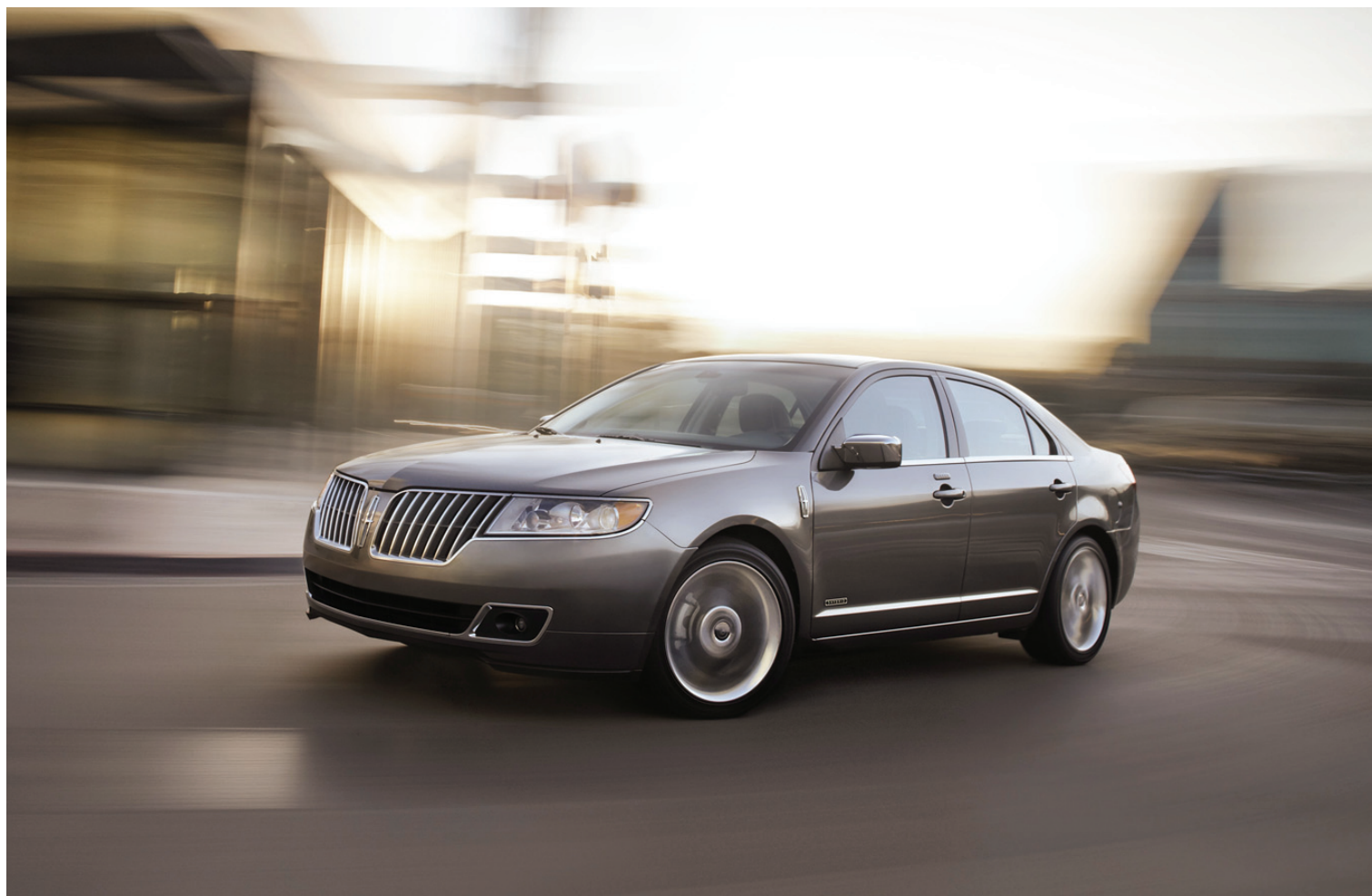
Première voiture de luxe hybride nord-américaine, la Lincoln MKZ hybride est un exemple de ce que Ford peut bien faire avec cette technologie.

Contrairement à plusieurs qui considèrent la nouvelle calandre caractéristique des nouvelles Lincoln comme un peu trop grosse, je dois avouer que je trouve celle-ci plutôt élégante et empreinte d'une certaine