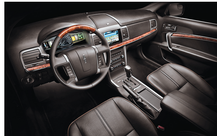
Le design intérieur de la Lincoln MKZ est d'une banalité qui détonne avec ce qui se fait de mieux ailleurs.

■ Moteur: 4 cylindres 2,5 litres à cycle Atkinson ■ Transmission: À variation continue (CVT) ■ Puissance: 156 chevaux à 6000 tours/min ■ Consommation combinée observée: 5,8 litres/100 km ■ Prix de base: (modèle 2012): 43 850 $