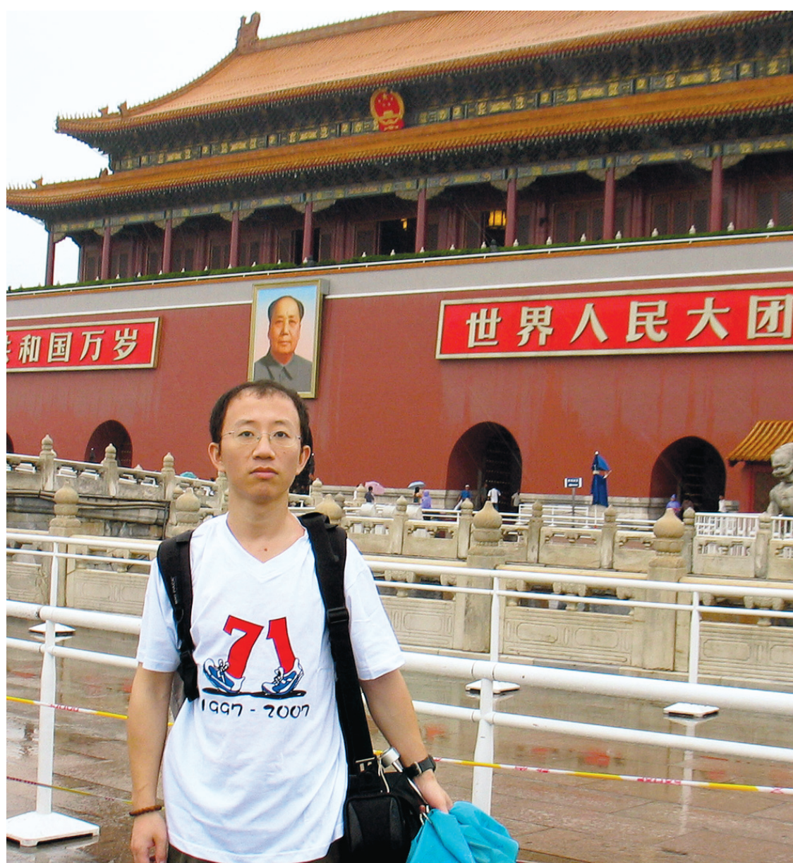
Hu Jia en juin 2007 à Pékin