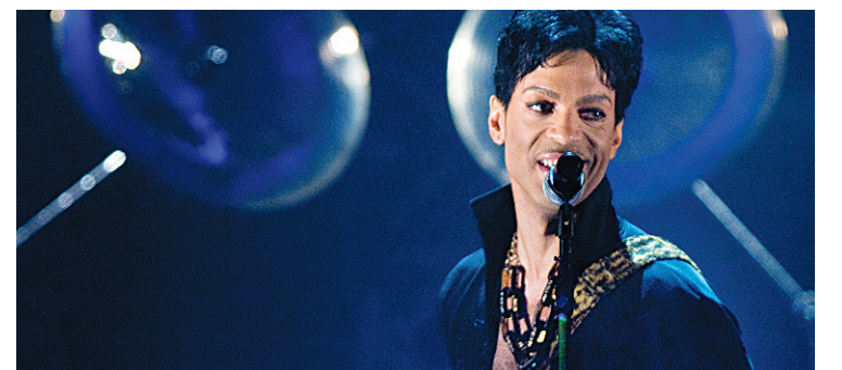
Prince en pleine prestation au Métropolis