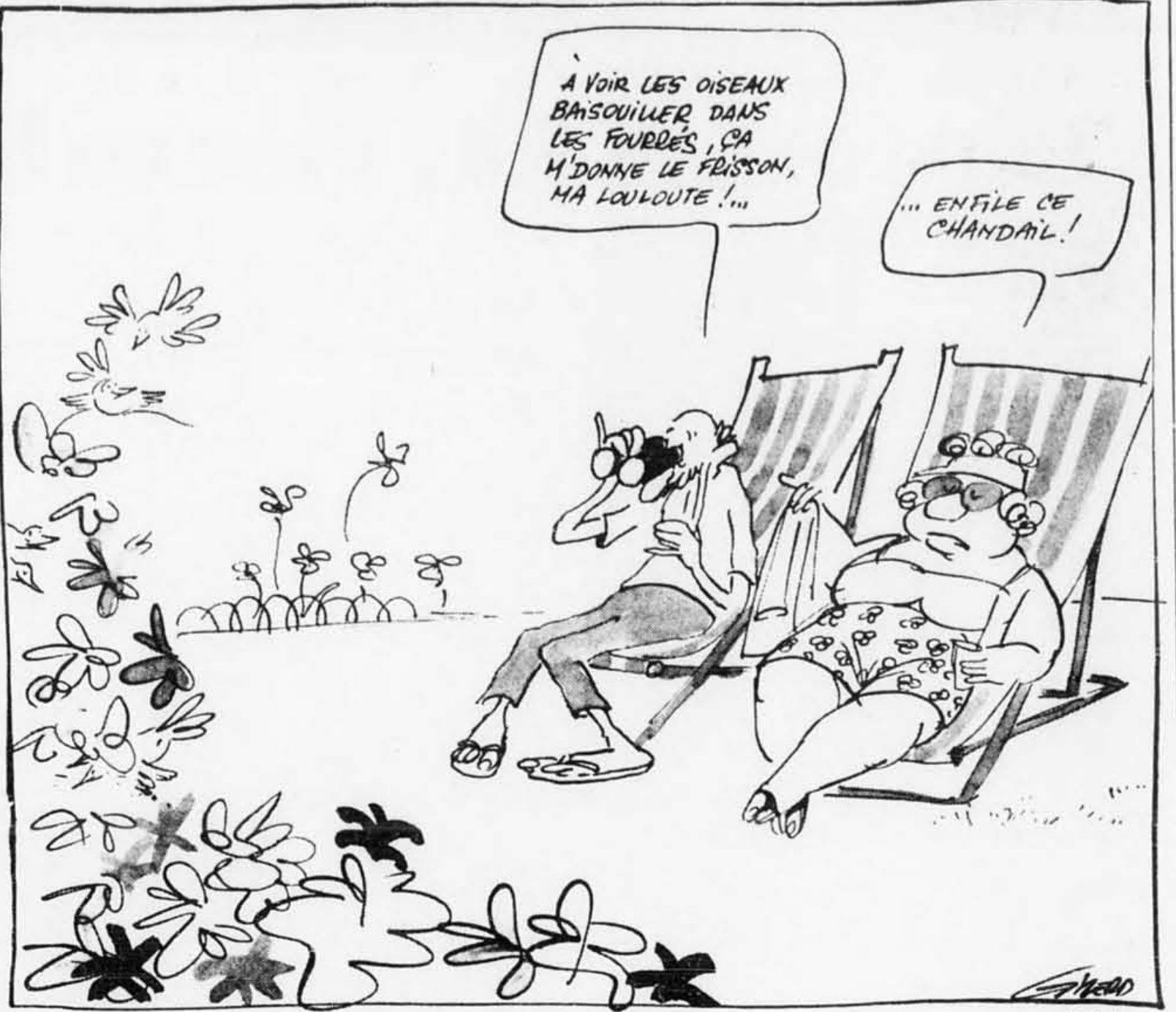
Reprise du 22 mai 1984