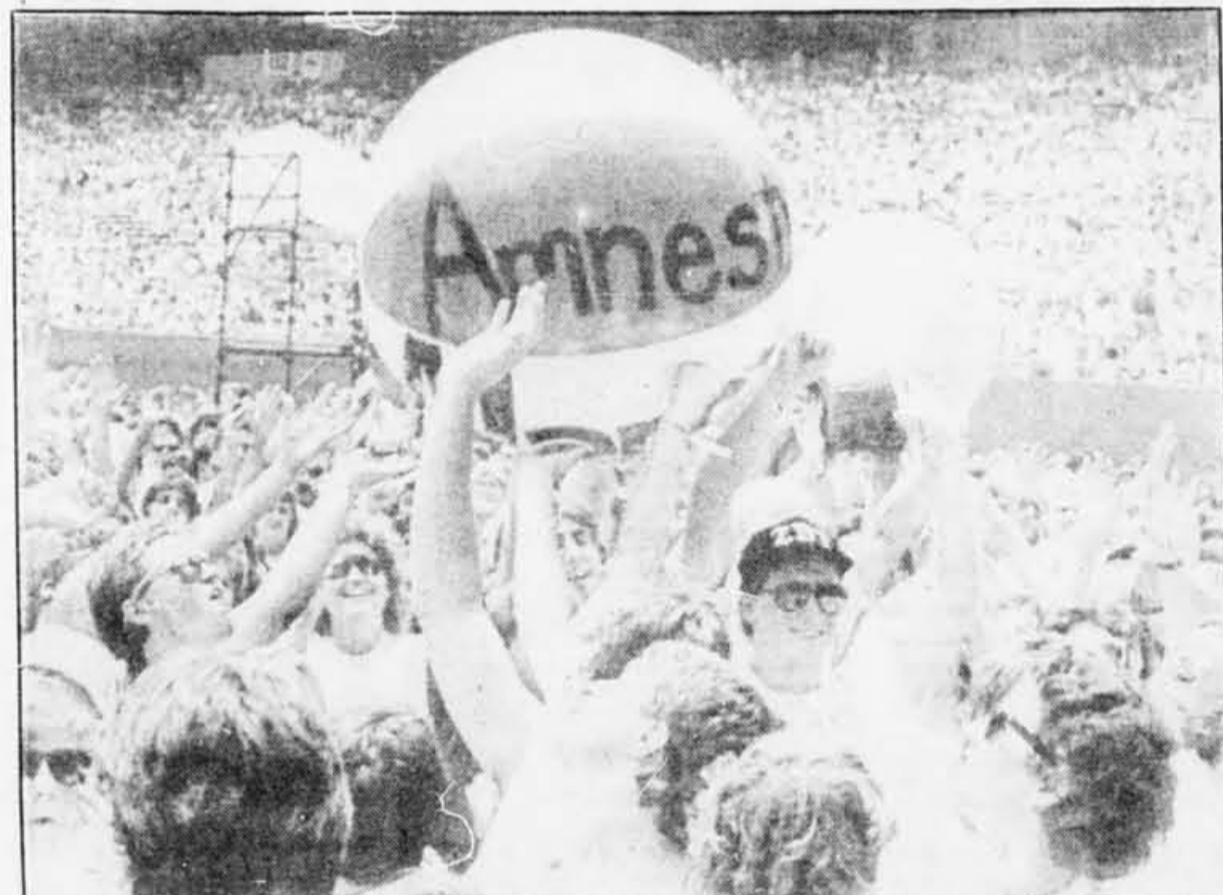
Pendant que les vedettes évoluaient sur scène, des milliers de spectateurs, dans le stade, ont fait la vague en déplaçant constamment un immense ballon de plage frappé du sigle d'Amnistie Internationale.