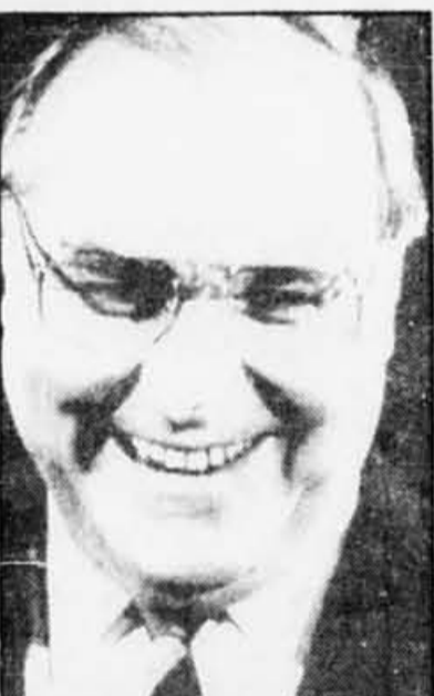
Le chancelier Helmut Kohl.

À sept mois des élections législatives, la consultation régionale d'hier avait valeur de test national. Elle redonne un ballon d'oxygène bien nécessaire aux