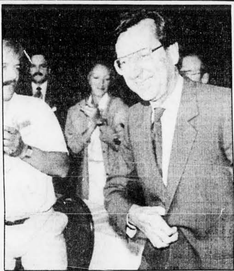
Le chef libéral Robert Bourassa est accueilli par les délégués au moment de prononcer son discours de clôture du Conseil général du PLQ, tenu ce week-end.

Il devra aussi déclarer le nom de toute société privée dans laquelle il détient des intérêts, ou de toute société publique dont il a le contrôle, et qui est susceptible de faire affaires avec le gouvernement ou d'être partie à un marché avec l'État.