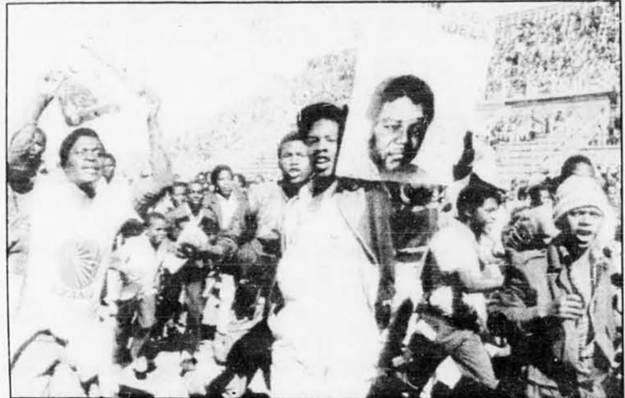
À Harare, au Zimbabwe, des membres en exil du Congrès national africain avaient organisé une manifestation de masse, hier, pour marquer le dixième anniversaire des événements de Soweto.