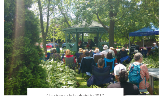
Classiques de la glorieette 2017