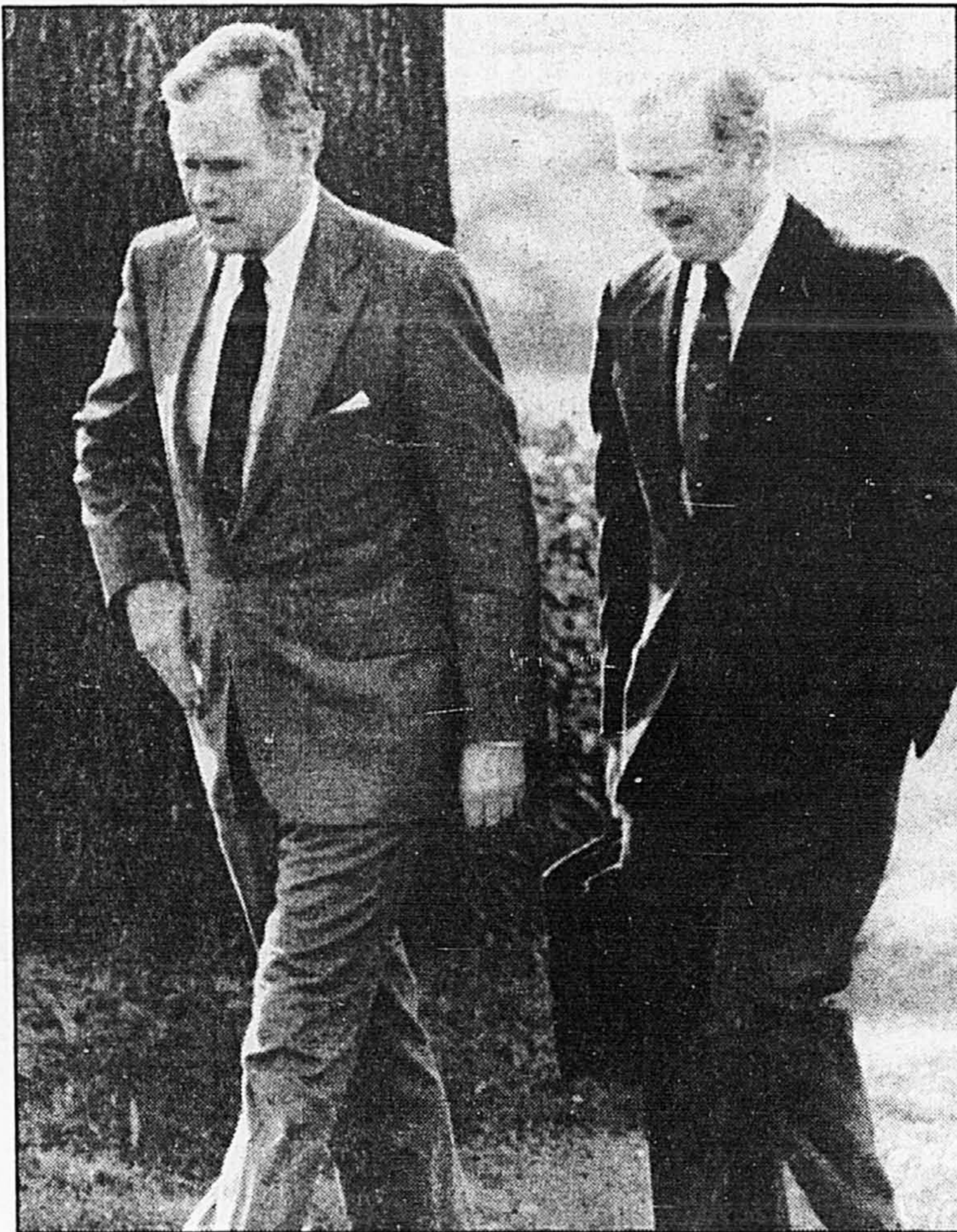
Le président George Bush et le Secrétaire d'État James Baker juste avant l'ultimatum livré à l'Irak.

L'analogie avec la guerre de Corée ne porte pas que sur les origines du conflit. Elle doit embrasser aussi les conséquences économiques et politiques. Souhaitons que la relance qu'annonce la reconstruction du Koweït n'ait pas un volet militaire, que l'Irak ne connaisse pas l'ostracisme qui frappa la Corée du Nord, que la diplomatie succède à la force. Les analogies, après tout, n'ont toujours qu'une utilité et qu'une application partielles, car les situations ne sont jamais semblables et exigent des réponses adaptées aux différences de temps et de lieux.