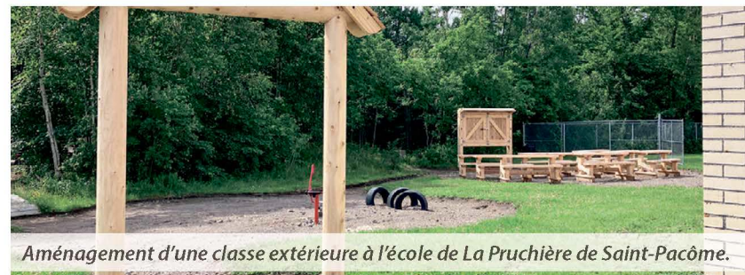
Aménagement d'une classe extérieure à l'école de La Pruchière de Saint-Pacôme.

Le Centre de services scolaire de Kamouraska—Rivière-du-Loup procède actuellement à différents travaux d'amélioration de ses immeubles, lesquels représentent des investissements de plus de 17,4 M$, soit 3,4 M$ de plus que l'été dernier.