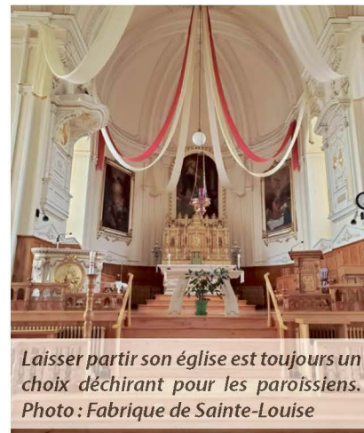
Laisser partir son église est toujours un choix déchirant pour les paroissiens.

d'autre choix », conclut Mme Tardif. La Fabrique espère que cette mise en vente suscitera l'intérêt, et qu'une nouvelle vie pourra être offerte à l'église, afin qu'elle reste un lieu de rassemblement.