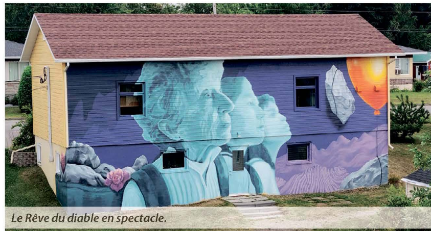
Le Rêve du diable en spectacle.