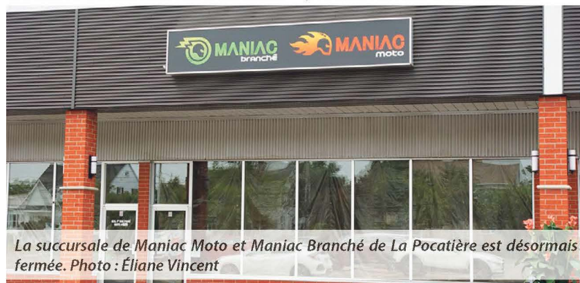
La succursale de Maniac Moto et Maniac Branché de La Pocatière est désormais fermée.

commerce sous les bannières CF Moto, Yamaha, Apollo et Scootterre, et se spécialisant également dans la vente de motos usagées de marque Harley Davidson. Quant à la division Maniac Branché, elle se spécialise dans les véhicules récréatifs électriques, tels que les vélos, motos, triporteurs, scooters, trottinettes, etc.