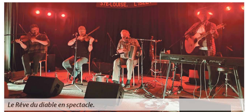
Le Rêve du diable en spectacle.