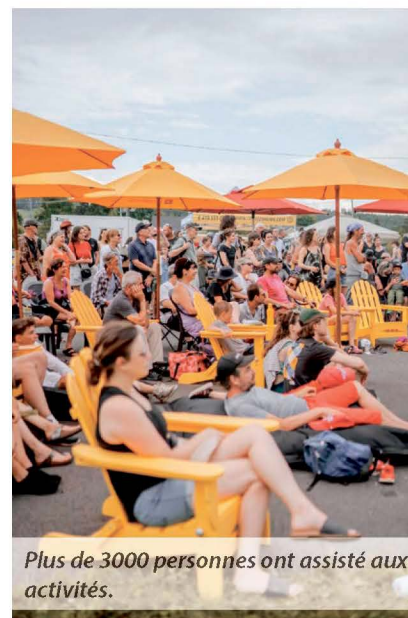
Plus de 3000 personnes ont assisté aux activités.