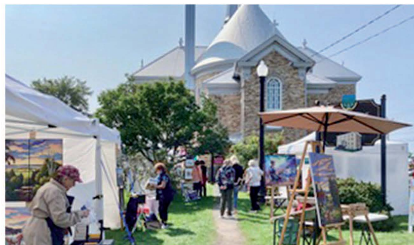
Les artistes du groupe Reg'art attendent les visiteurs pour le dernier événement de la saison.