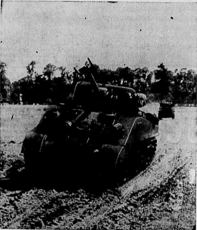
Après un terrible barrage d'artillerie, les troupes britanniques ont lancé une nouvelle offensive dans le secteur Tilly-Caen, le 25 juin. Une tête de pont de deux milles de largeur fut établie sur la rivière Odon, et les chars d'assaut, les canons et l'infanterie se préparèrent à l'une des batailles les plus disputées de l'invasion. Ci-dessus des chars Sherman se lançant à l'offensive, dans le secteur de Caen.

Radio, modèle de table, machine à coudre, machine à laver électrique, fer à repasser, grille-pain, divan Davenport et plusieurs autres articles. S'adresser à 67A rue Sherbrooke, Magog.