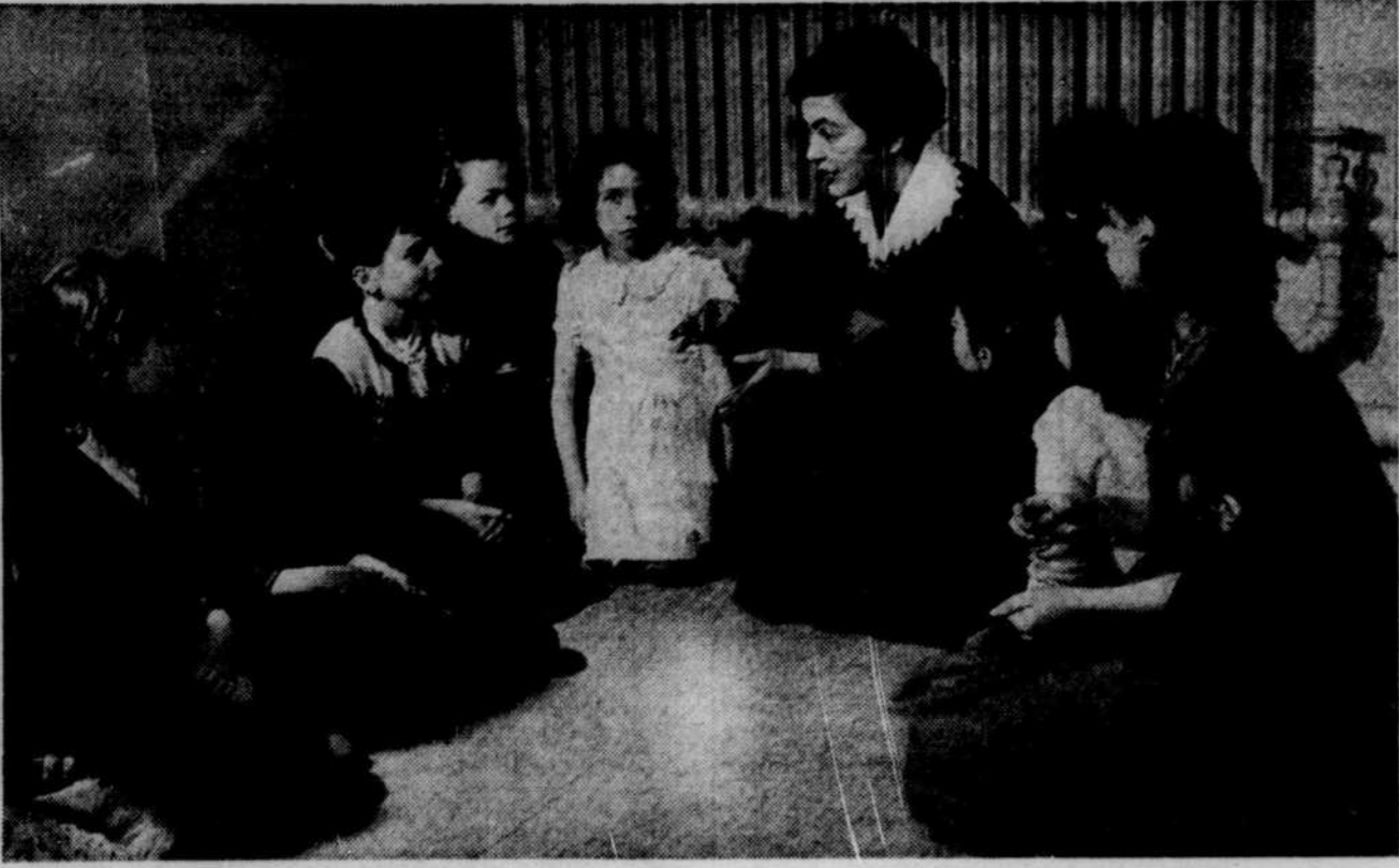
Une monitrice de la Colonie de vacances du Sacré-Coeur raconte une histoire à un groupe de fillettes réunies au local de la rue Lagouchière. Sauf pour une, momentanément distraite par la présence du photographe, la partie est gagnée: l'intérêt est à son comble et, dans les regards des fillettes, une lueur de confiance. Chez la monitrice, on décèle dans le regard et jusque dans le jeu des mains, un don de tout l'être.