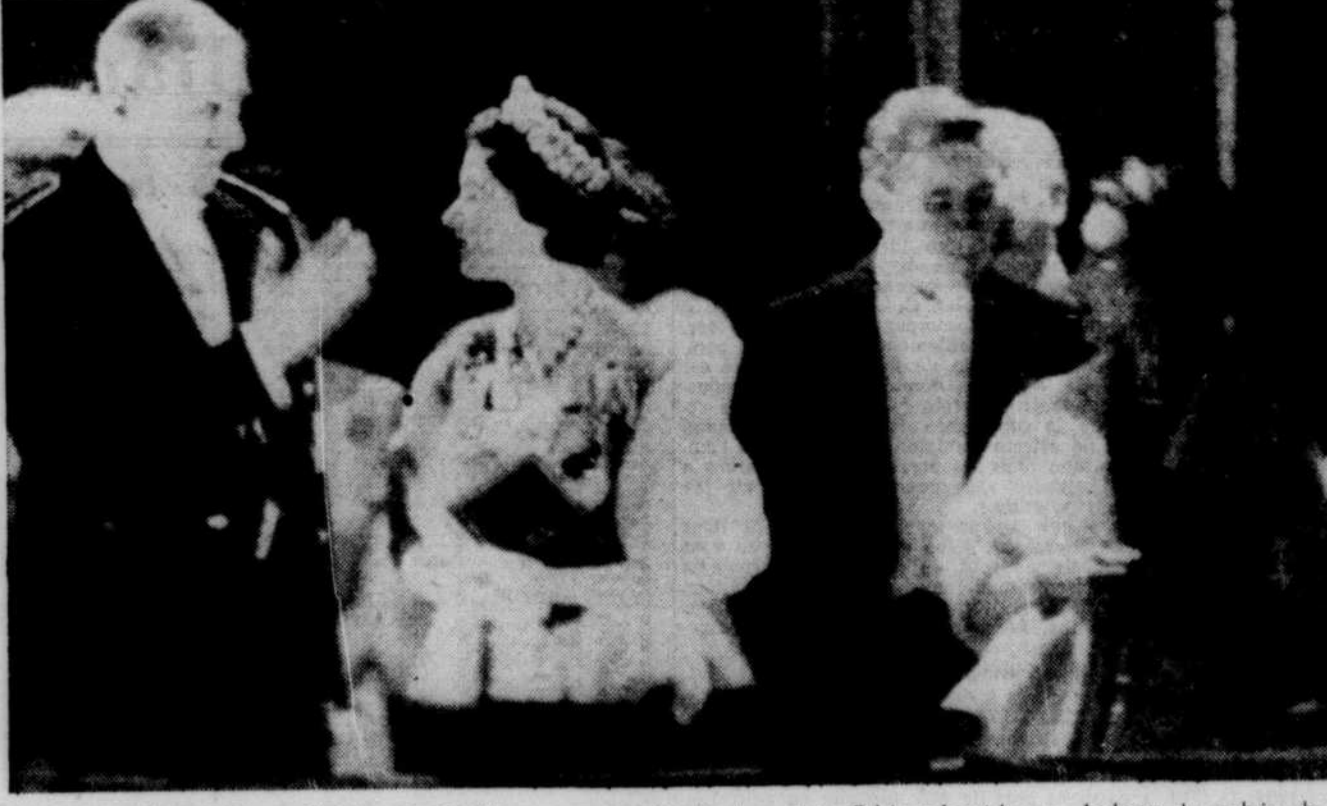
On voit ici le président Charles de Gaulle en compagnie de la reine Elisabeth au balcon du palais de Buckingham, où il est venu saluer la foule qui le réclamait, mercredi soir. Le président est en tenue d'apparat de général de brigade. A droite, la princesse Margaret et son fiancé, Anthony Armstrong-Jones.

sa reconnaissance syndicale le 11 février dernier. Avant que la CRO ne prenne une décision et ne pose un gène, l'employeur a procédé à des congédiements. Finalement, le 8 mars, après enquête faite par des inspecteurs de la CRO, la Commission ordonnait la tenue d'un vote secret dont la date avait été fixée au 8 avril, soit cette semaine.