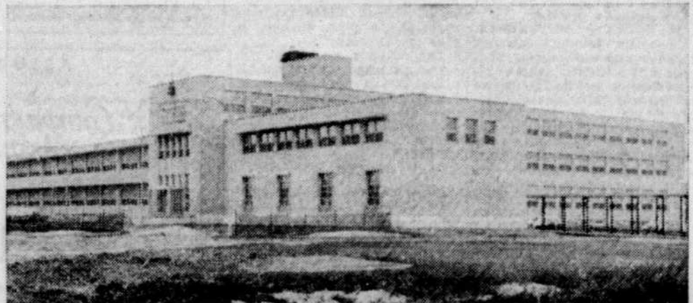
L'Institut des arts graphiques, sur la rue St-Hubert, un immeuble qui a coûté $2,831,182.18