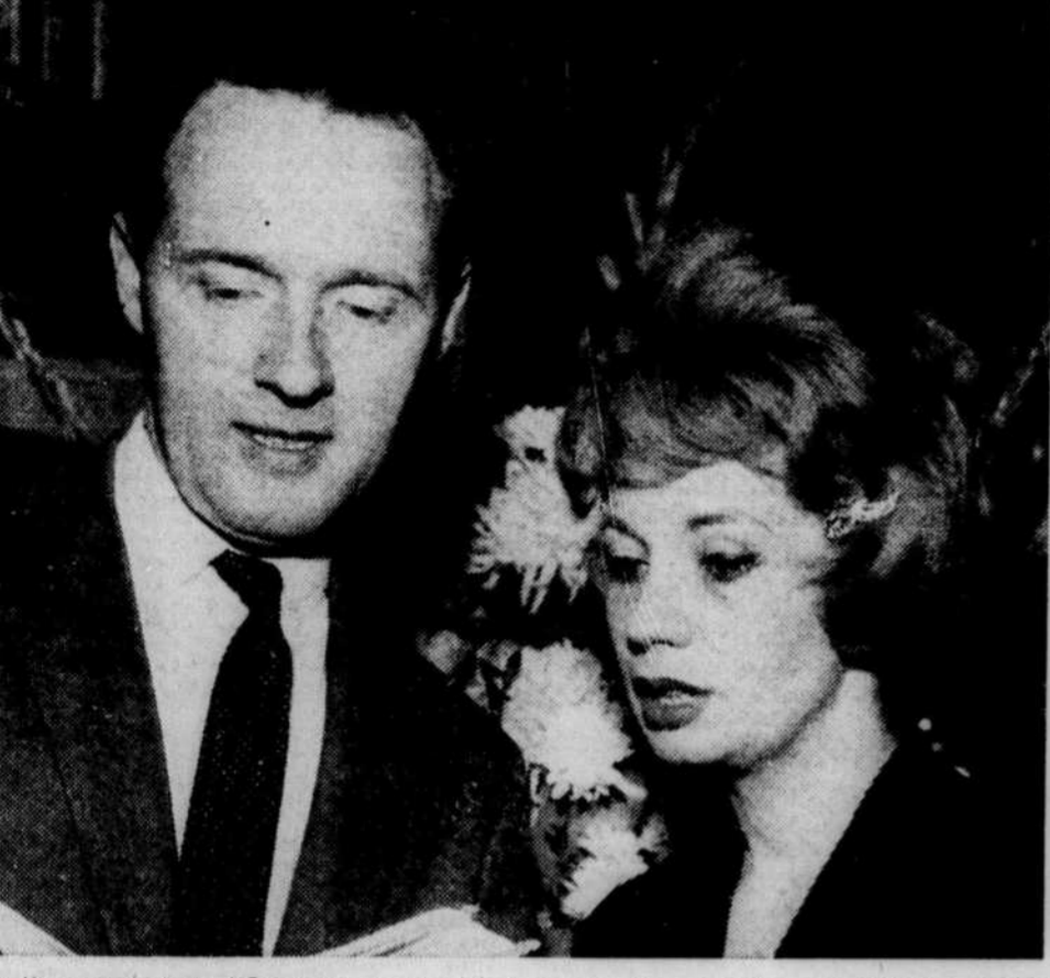
A l'occasion de la "Semaine du Livre", une réception a eu lieu à la Librairie DEOM pour inaugurer la rénovation du magasin.