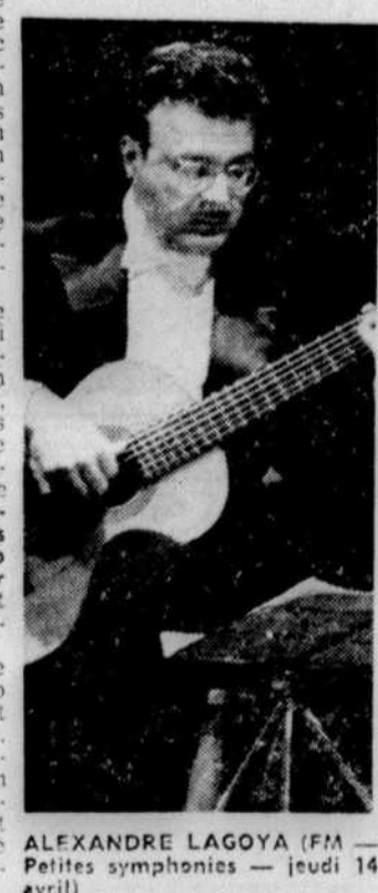
ALEXANDRE LAGOYA (FM — Petites symphonies — jeudi 14 avril)

Pour capter les émissions de la nouvelle chaîne voici quelques conseils qui pourront être utiles. Deux cas sont à considérer: 1 — Si vous possédez un appareil de haute fidélité, mais du type régulier (modulation d'amplitude), vous pouvez vous procurer un synthétiseur FM qui, une fois relié à votre appareil, vous fera bénéficier des avantages que procure ce procédé de radiodiffusion excellent: transmission de la gamme sonore des instruments de l'orchestre, grande fidélité dans la reproduction des nuances (pianissimo et fortissimo) et enfin, élimination presque totale des bruits de fond et parasites.