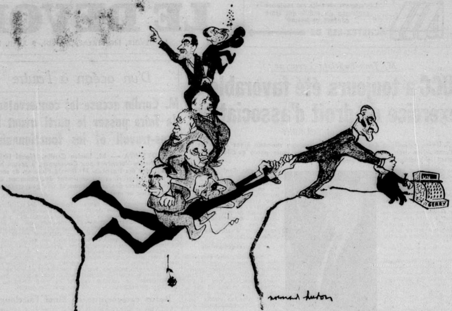
Je me soutiens