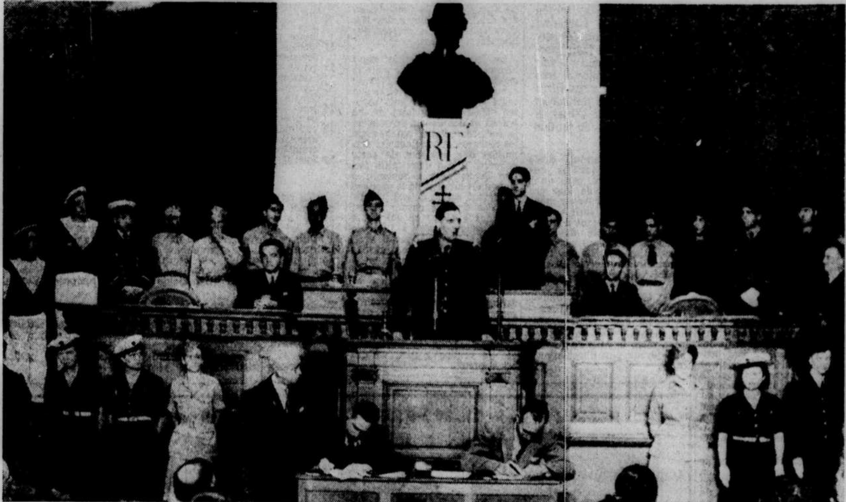
De Gaulle devant l'Assemblée consultative à Alger en 1944. A ce moment, il ne représentait encore qu'un pays occupé et dévasté; aujourd'hui il peut parler d'égal à égal avec Londres.