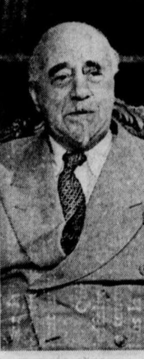
Sir THOMAS BEECHAM (FM — Opéra — Dimanche 10 avril)

2 — Un fonds de secours et d'assurance-santé pour les acteurs. Les producteurs feront un versement initial de $375.000 pour établir ce fonds. 3 — Les producteurs céderont aux acteurs six pour cent des profits nets qui seront réalisés grâce à la vente à la télévision des films d'après 1960. 4 — Le nouveau contrat de trois ans établit les salaires minimums suivants: acteurs à la journée, $100; acteurs à la semaine, $350; acteurs case-cou (stunt men), $100 par jour. La grève impliquait 200 comédiens et comédiennes, mais elle paralysait au total 6.500 travailleurs de l'industrie du cinéma.