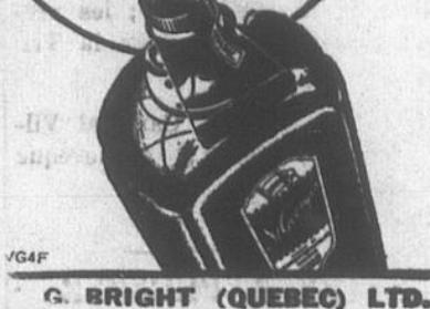
G. BRIGHT (QUEBEC) LTD.

Type Perth ou Type Sherry Cruche d'un Gallon 160 oz. 1.75 Bout. de 26 oz. Bout. de 40 oz. 40 60