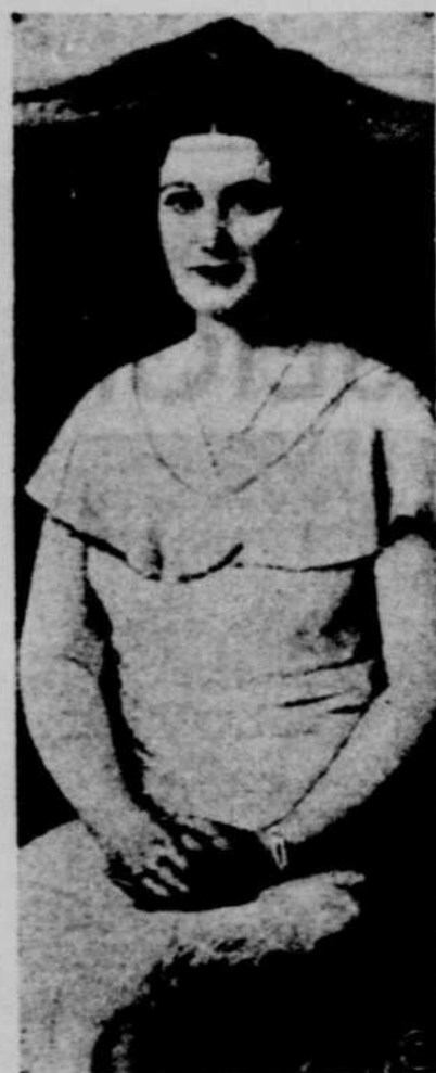
Madame Frau Dollfuss dans sa plus récente photographie

Afin d'assurer l'indépendance de l'Autriche et d'empêcher la marche des allemands sur Vienne, Mussolini dépêcha 50,000 soldats à la frontière. Il employa des paroles énergiques pour