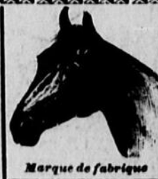
Marque de fabrique

Premier par le poids Premier par la qualité Premier par les résultats Premier sous tous rapports