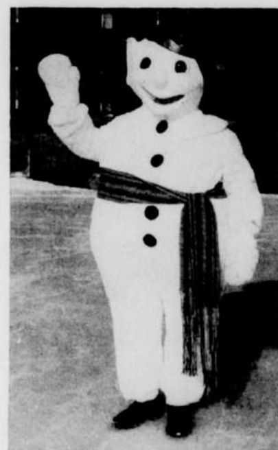
LE BONHOMME CARNIVAL

Le samedi soir 16 février aura lieu le couronnement de la Reine du Carnaval alors que sept jeunes beautés qué-