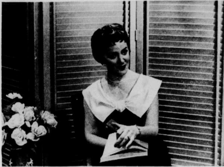
LUCILLE DUMONT est la charmante hôtesse de l'émission A la Romance que les téléspectateurs retrouvent tous les samedis soirs vers 10 h. 30. Lucille nous présente avec beaucoup de grâce ses artistes invités. Elle-même, accompagnée par l'excellent orchestre que dirige Lionel Renaud, interprète les plus belles mélodies de son répertoire français et américain. Celle qui a mérité le titre de "grande dame de la chanson" s'est constamment renouvelée à la télévision malgré une carrière déjà longue. Jeune et frais, voilà son talent. A la Romance est réalisé par Roger Barbeau.