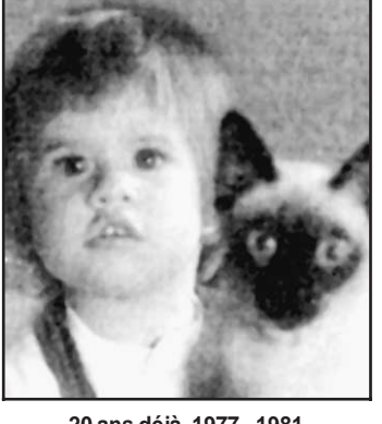
20 ans déjà, 1977 - 1981