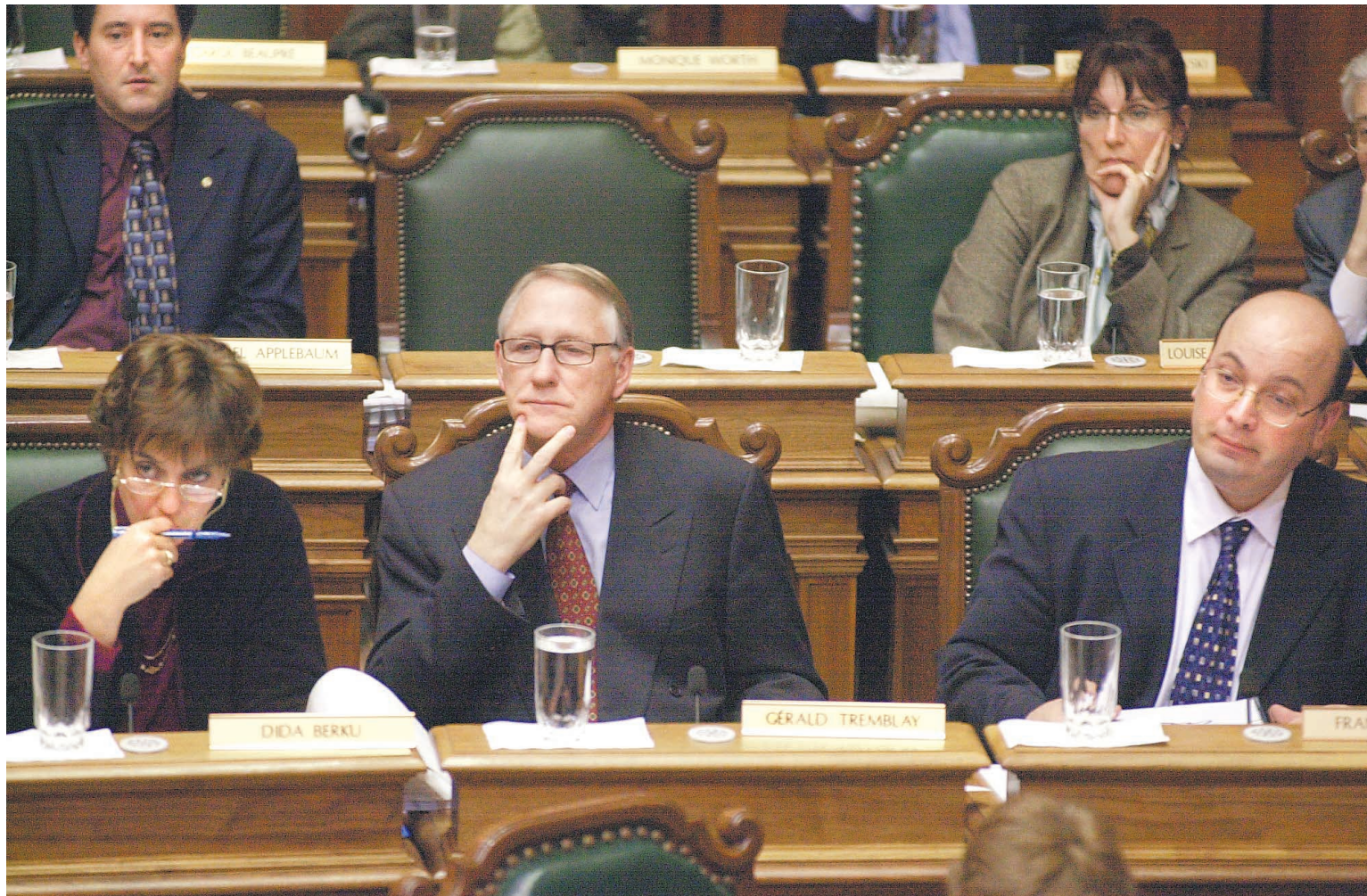
« L'engagement qu'on a pris, c'est qu'on n'augmenterait pas la charge fiscale globale des contribuables de l'île de Montréal, et nous avons respecté cet engagement ! » a dit, hier, le maire de Montréal, Gérald Tremblay.

Que les moutons gloutons que nous sommes se le tiennent pour dit.