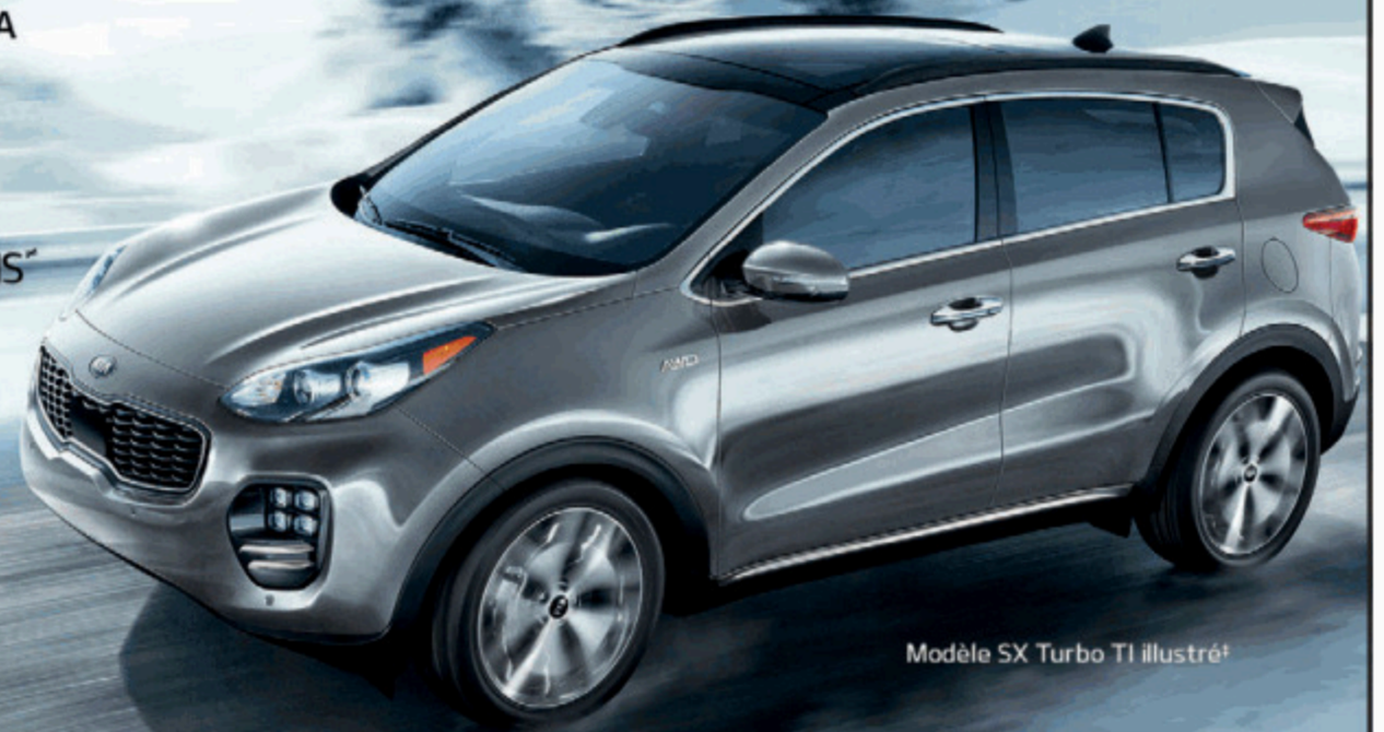
Modèle SX Turbo TI illustré

MOTEUR DE SÉRIE : 2,4 L GDI 4 CYL. MOTEUR DISPONIBLE : MOTEUR 2 L TURBO GDI