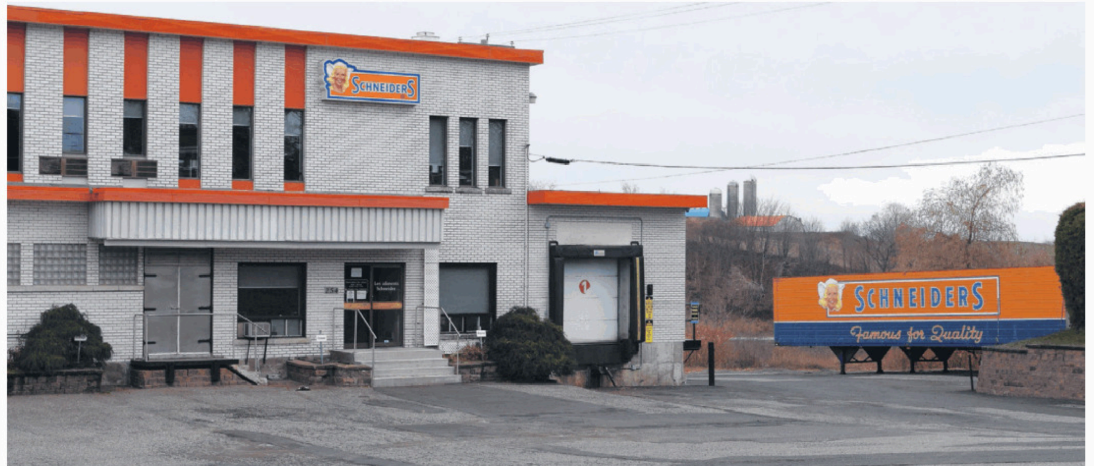
L'usine des Aliments Maple Leaf de Saint-Anselme fermera ses portes dans quelques mois.

La priorité des Aliments Maple Leaf est dirigée vers les employés dans le but de les supporter pour la