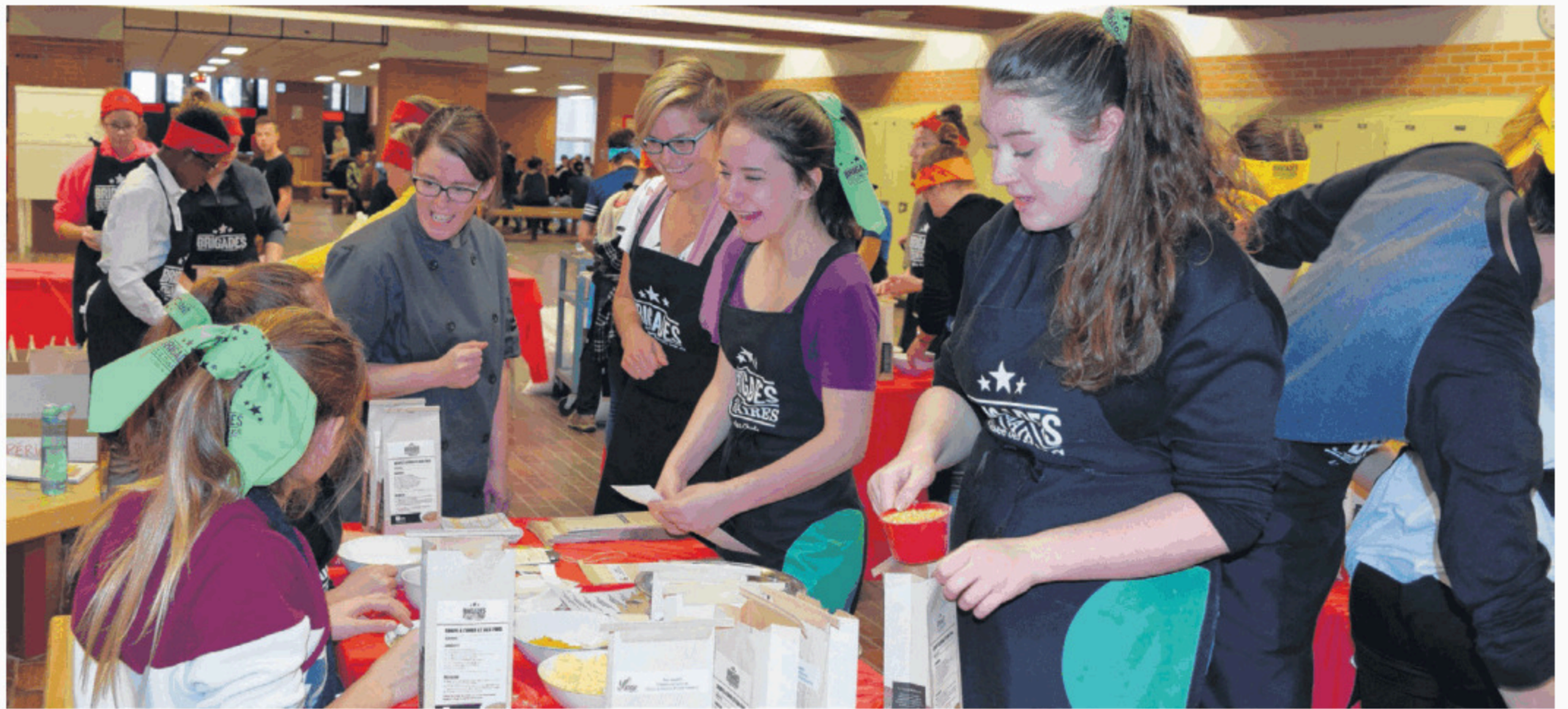
Les jeunes inscrits à l'activité d'art culinaire ont produit des sacs de soupe qui seront éventuellement distribués dans le milieu.

Elle ajoute que chacune des équipes devait produire 50 sacs d'ingrédients secs servant à produire une soupe à l'orge et aux pois. Les sacs seront éventuellement