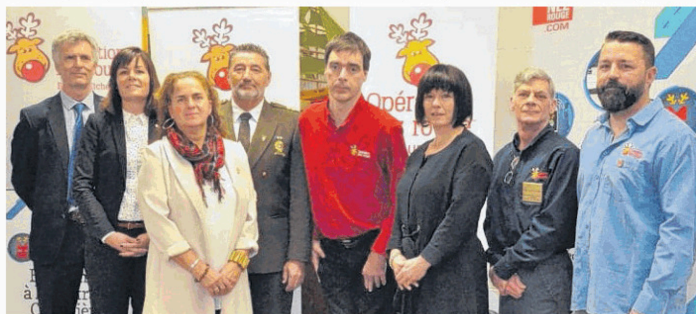
Les responsables et partenaires de l'Opération Nez rouge ont besoin plus que jamais de bénévoles.

Pour s'inscrire en tant que bénévole, il suffit de se rendre sur le site Internet www.operation-nezrouge.com et de sélectionner la région. «Nous vous demandons de le faire au moins trois jours avant la date de votre participation ou de vous rendre directement à la centrale de votre secteur à compter de 20h», détaille le coordonnateur.