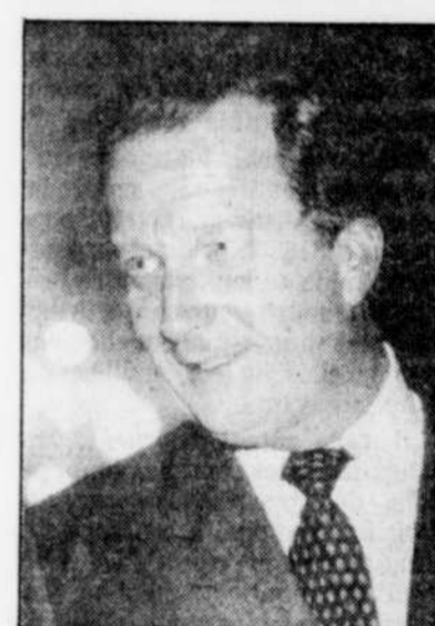
Sa majesté Albert II, roi des Belges.

BRUXELLES (AP, AFP, Reuter) — Le Prince Albert de Liège, 59 ans, frère du Roi Baudouin décédé dans la nuit de samedi en Espagne, sera le sixième roi des Belges, a annoncé hier le premier ministre, Jean-Luc Dehaene.