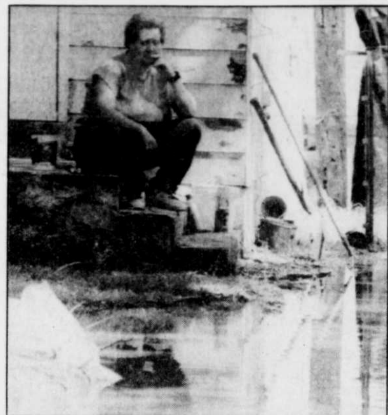
L'eau continue de monter

Les sondages ont été réalisés le 25 juillet, au lendemain de l'annonce de la réforme monétaire et depuis, la popularité de Boris Eltsine pourrait même encore avoir baissé.