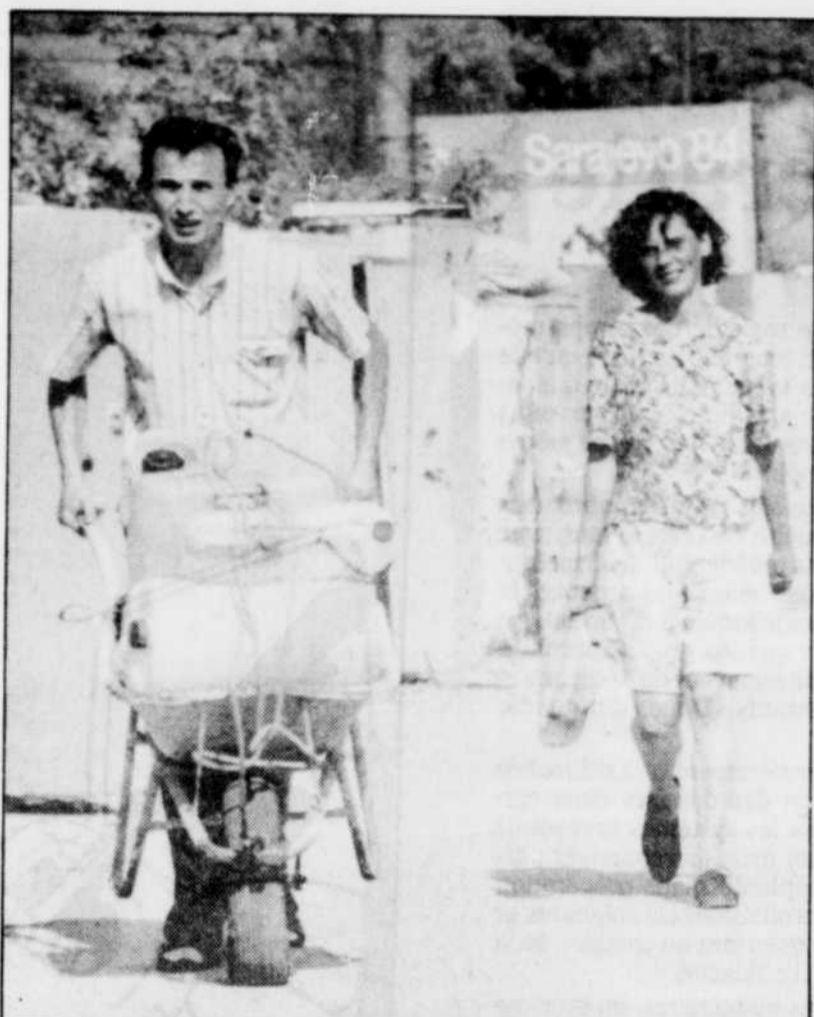
Sous la protection d'une rangée de classeurs, deux résidents de Sarajevo, qui viennent de se ravitailler en eau, passent devant un panneau rappelant qu'en 1984 leur belle ville, aujourd'hui ravagée par la guerre, avait été l'hôte des Jeux olympiques d'hiver.

Le président musulman a ajouté qu'il en avait averti les co-présidents de la conférence, David Owen et Thorvald Stoltenberg ainsi que le leader serbe bosniaque Radovan Karadzic. Mais il a ajouté qu'il poursuivrait les négociations aujourd'hui.