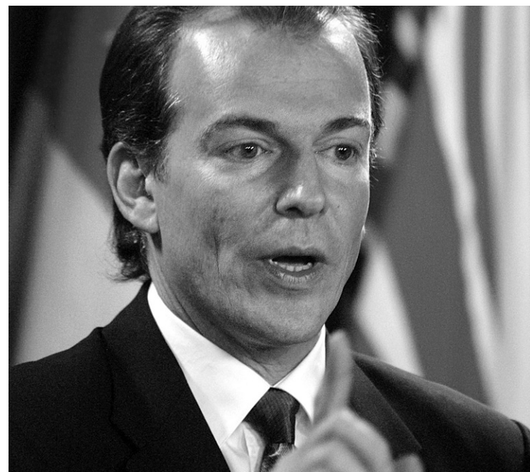
André Bachand, qui est l'actuel ambassadeur du Canada à l'UNESCO, entrera en fonction «plus tard cet automne».

À Québec, au secrétariat aux Affaires intergouvernementales canadiennes, on souligne que l'ancien maire d'Asbestos (1986 à 1997) est au fait des enjeux du Québec, rappelant qu'il a été délégué du Québec à Ottawa de 2004 à 2008 avant de tenter en vain un retour dans l'arène politique fédérale en se portant candidat conservateur dans Sherbrooke.