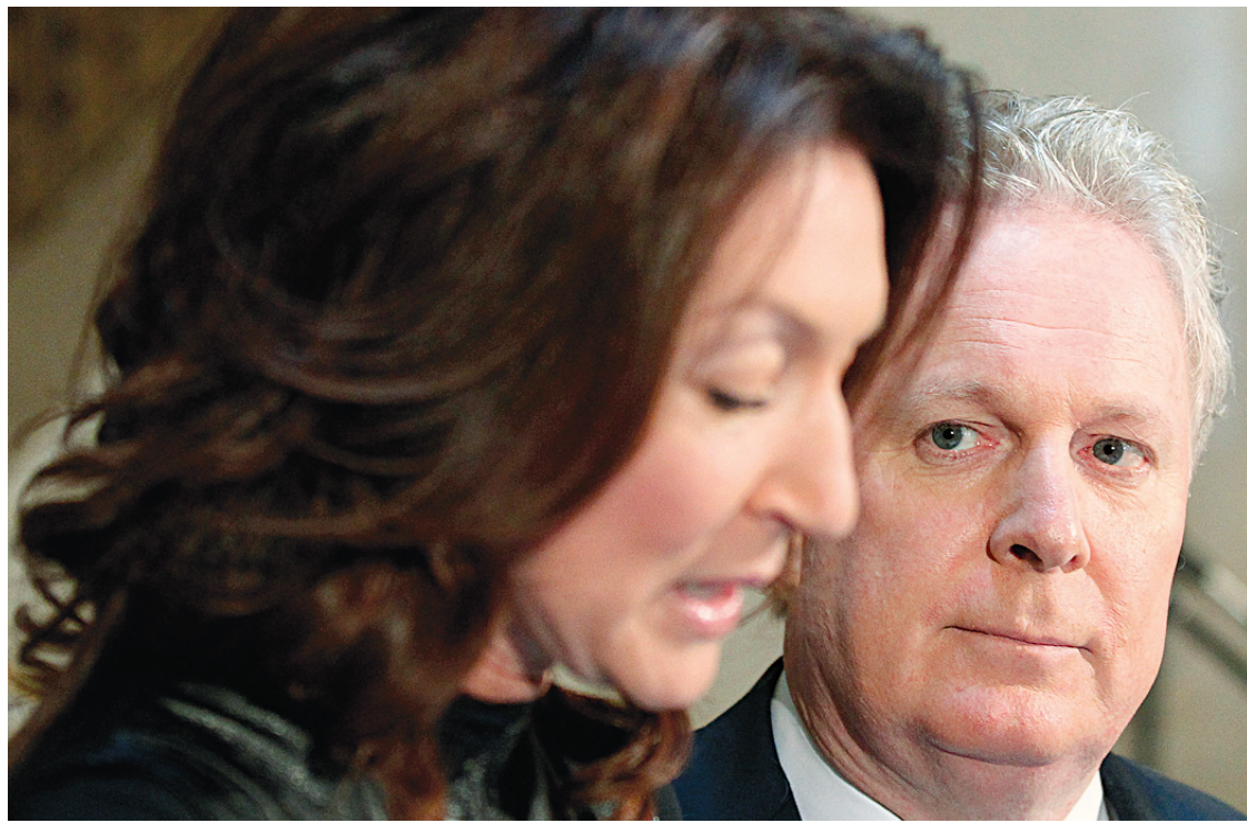
Le départ de Nathalie Normandeau représente une lourde perte pour Jean Charest.