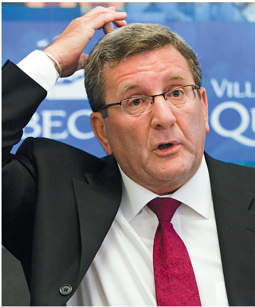
CLÉMENT ALLARD LE DEVOIR

La journée avait pourtant bien commencé pour le maire Labeaume qui, après des mois de négociations,