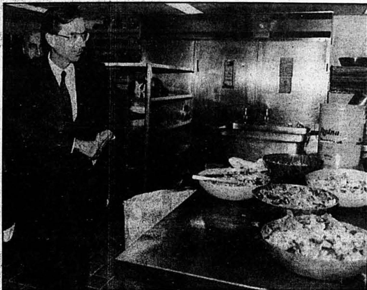
Le premier ministre Robert Bourassa s'est esquivé par la cuisine, hier, après son discours devant le Canadian Club afin d'éviter la trentaine de manifestants qui l'attendaient à l'extérieur.