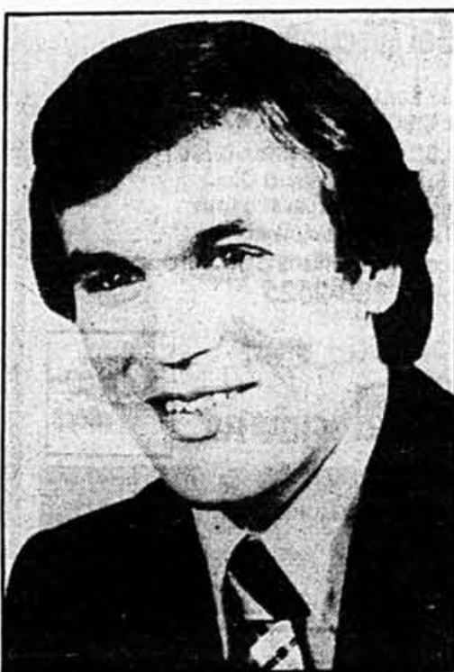
Le ténor hongrois Dénés Gulyás chante le rôle-titre de Faust , de Gounod, qui ouvre ce soir la dixième saison de l'Opéra de Montréal.

«Dans ma mise en scène, dit-il, Faust n'est pas un vieillard mais un homme qui a entre 40 et 50 ans. Pourquoi faudrait-il qu'il soit un vieillard? Rien dans le texte ne l'indique. Au contraire, Faust est un homme qui s'interroge et, justement, je pense que c'est entre ces âges-là, 40-50 ans, qu'on s'interroge — sur l'existence de Dieu, par exemple. Faust appelle Dieu et n'obtient pas de réponse. Alors, il appelle le Diable, qui apparaît immédiatement. Dans ma mise en scène, Méphisto (le Diable) est d'ailleurs le double de Faust. Je crois que c'est tout à fait logique puisque Faust choisit finalement le mal qui est en lui, comme il est