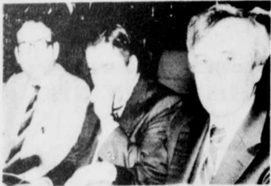
Le ministre MacGuiguan, à droite, et deux membres de la délégation canadienne.

te" et une atteinte caractérisée à la détente est-ouest. Les Etats-Unis ne continueront à participer aux travaux de la conférence sur la sécurité et la coopération en Europe (CSCE), dans les jours qui viennent à Madrid (Espagne), que si ces travaux sont centrés sur l'actuelle situation en Pologne, a annoncé mardi le secrétaire