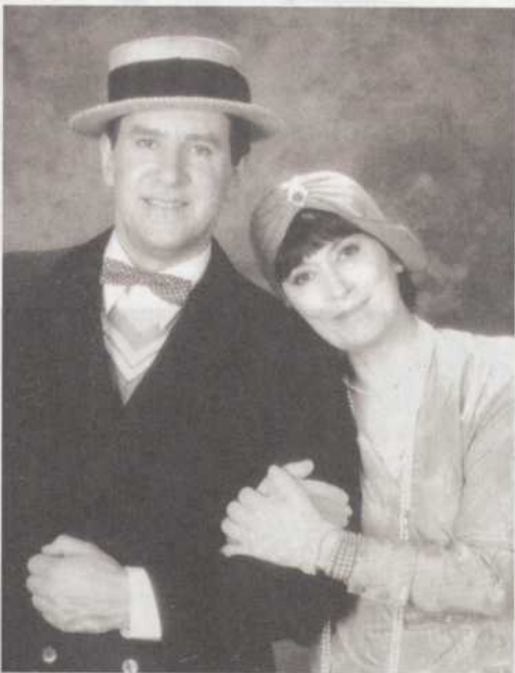
Gilles Renaud et Monique Miller lors de leur collaboration au téléroman Montréal PQ de Victor-Lévy Beaulieu, diffusé de 1992 à 1994 à la télévision de Radio-Canada.