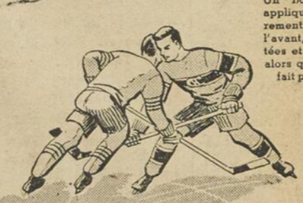
Un "body check" bien appliqué, le corps légèrement incliné vers l'avant, les jambes écartées et la tête tournée, alors que le contact se fait par les épaules.

CEUX qui veulent jouer en défense au hockey devraient étudier le jeu de "Butch" Bouchard des Canadiens. Sa méthode consiste à surveiller le côté de la glace où il se trouve, de façon à ce que personne ne vienne autour de lui. Si le jeu se porte de l'autre côté de la glace, "Butch" va à la rescousse de son co-équipier. Si ce dernier est défait, il coupe alors derrière lui. Il pratique la poussée (body check) comme dernière ressource seulement et il préfère, si la chose est possible, mettre l'avant des adversaires hors jeu sans risquer le pénalité. Il cherche toujours à se tenir en avant des