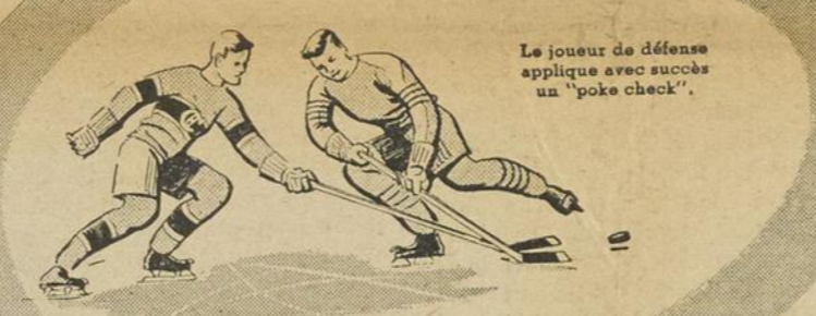
Le joueur de défense applique avec succès un "poke check".