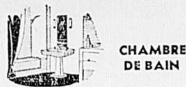
CHAMBRE DE BAIN

BANQUE CANADIENNE Nationale BANQUE DE MONTREAL ROBERVAL, P. Q.