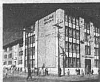
SECONDAIRE - MONTRÉAL 185, Fairmount Ouest, Montréal