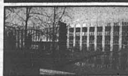
SECONDAIRE - LONGUEUIL 1340, rue Nobert, Longueuil

RENSEIGNEMENTS, PROSPECTUS, INSCRIPTIONS: 495-2581