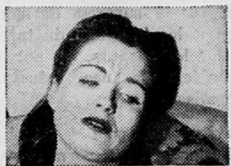
possède aussi ce que les Médecins appellent un effet tonique stomacal. NOTEZ: Vous préférez peut-être les TABLETTES LYDIA E. PINKHAM avec fer ajouté.

Votre âge est-il entre 38 et 52 ans et passez-vous cette difficile période fonctionnelle de "l'âge moyen" particulière aux femmes? Cela vous donne-t-il des poussées de chaleurs, vous sentez-vous le poux moite, très nerveuse, irritabilité faible? Définitivement, alors, essayez le Composé Pinkham's pour soulager de tels symptômes. Il est renommé pour ceci! Nombre de femmes avisées "d'âge moyen" prennent le Composé Pinkham's régulièrement pour aider à accumuler une résistance à ces ennuis.