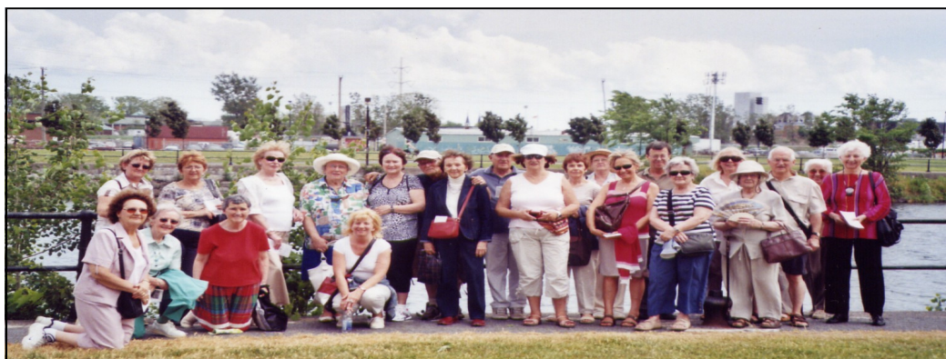
Au bord du canal Lachine

Dans le cadre de ses sorties du mercredi, le Centre des Aînés Côte-des-Neiges a organisé un pèlerinage littéraire afin de découvrir les lieux qui ont inspiré l'auteure Gabrielle Roy dans son livre Bonheur d'occasion et de marcher dans les pas des personnages de son roman qui a obtenu en 1947 le prix Fémina, à Paris.