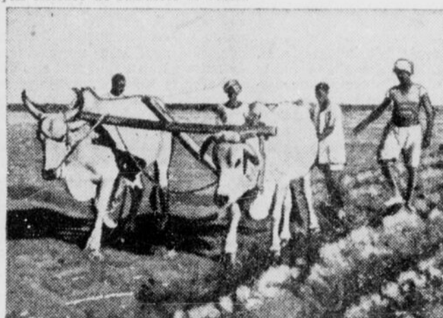
En plus de s'occuper des plantations de coton, les étudiants apprennent à cultiver toutes sortes de produits sur les fermes de la plaine de la Djezireh.

Les projets d'élevage déclarés en décembre 1951 indiquent que le nombre de cochonnages au printemps sera d'environ 22 p. 100 supérieure à celui de 1951 avec des augmentations proportionnelles analogues pour l'Est et l'Ouest.