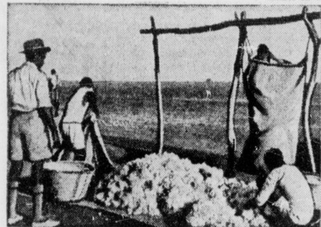
Les étudiants apprennent à déposer le coton brut dans de grands sacs pour le faire transporter ensuite, habituellement par des chameaux, vers les raffineries.