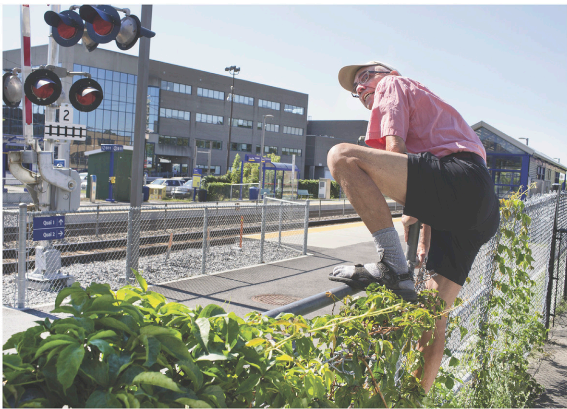
Alors que le litige entre la Ville de Montréal et le Canadien Pacifique perdure, les citoyens continuent de traverser les voies illégalement.