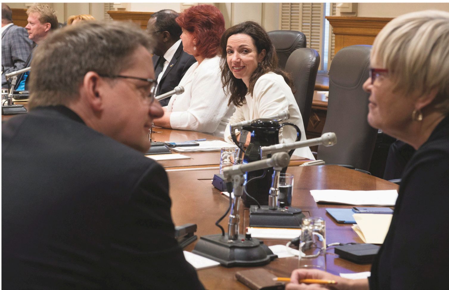
Martine Ouellet (au centre) a accusé mardi le chef intérimaire du PQ, Sylvain Gaudreault (à gauche) de s'être ingéré dans la course lorsqu'il est intervenu auprès d'elle pour critiquer certaines de ses déclarations publiques.