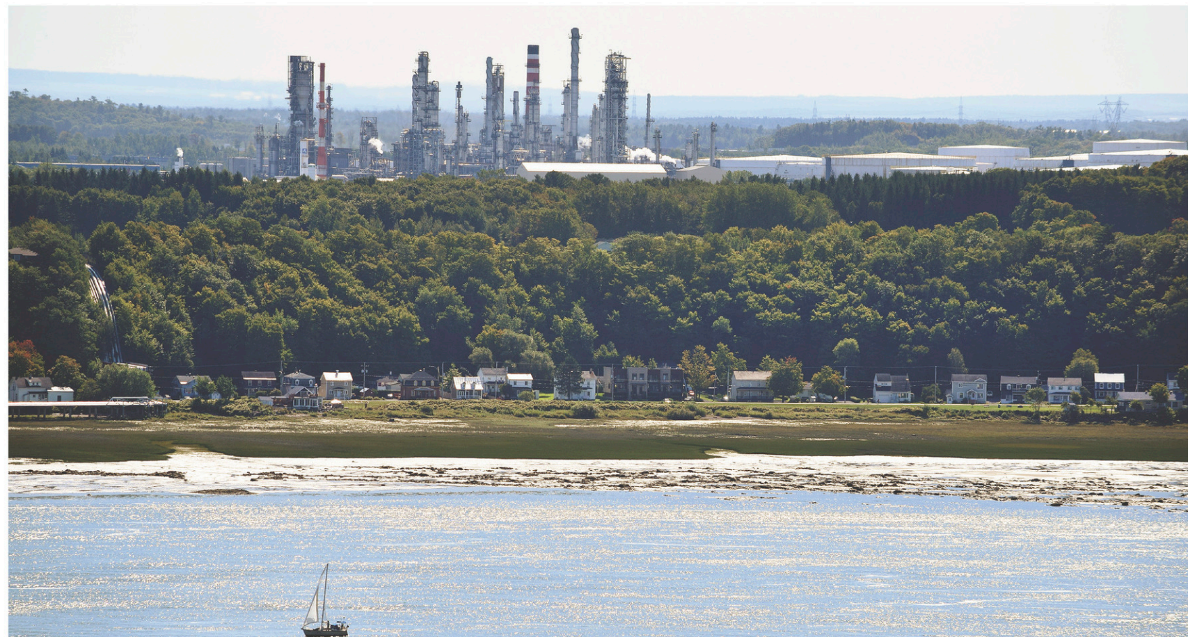
La raffinerie Valero, à Lévis, doit être un client du pipeline Énergie Est. On ne sait toutefois pas combien de pétrole serait destiné à cette usine chaque jour.