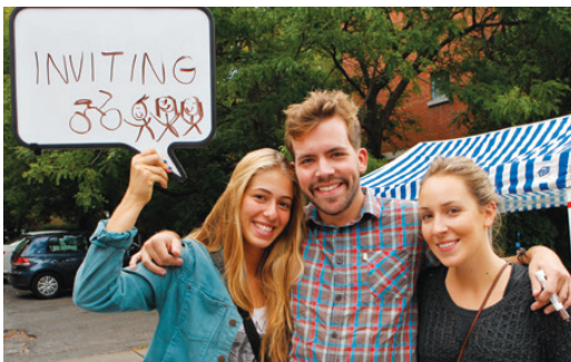
Des passants répondent à la question suivante : « Pour vous, une rue conviviale, c'est ? »

Sur le site Web du CEUM : http://www.ecologieurbaine.net/la-rue-que-nous-voulons