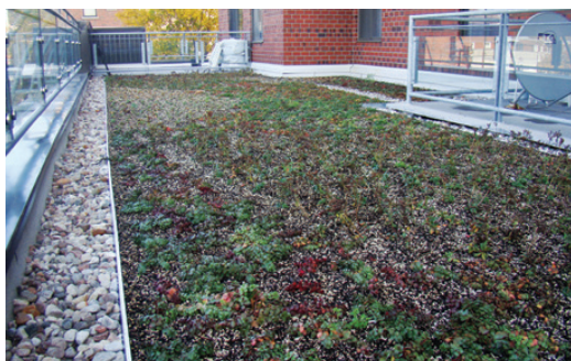
📍 Le toit vert réalisé aux habitations Jarry.