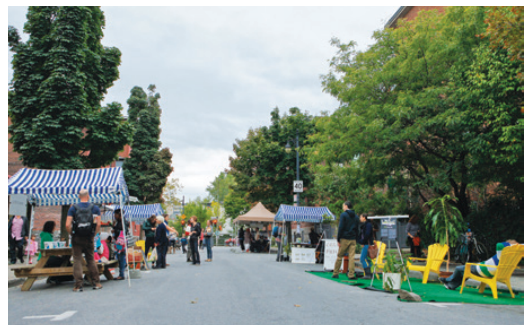
Un tronçon de la rue Milton ouvert exclusivement aux piétons.