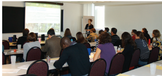
Plus de 140 professionnels des milieux municipal, de la santé publique et communautaire ont assisté aux séances de formation tenues en 2011-2012.

En plus des séances de formation, le CEUM offre à des communautés montréalaises qui auront participé à la formation Repenser les quartiers pour les piétons et les cyclistes – Réaliser un portrait de quartier pour des milieux de vie favorables aux déplacements actifs une banque de 20 heures d'accompagnement pour la réalisation de certaines étapes de leur portrait de quartier.