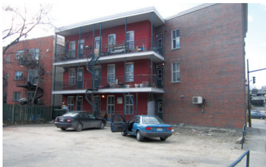
📍 L'aménagement réalisé aux habitations Lenoir-Saint-Antoine.