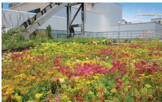
Section toit vert de Culti-Vert.

Sur le site Web du CEUM : www.ecologieurbaine.net/culti-vert