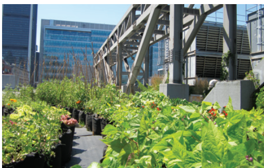
Section toit jardin de Culti-Vert.