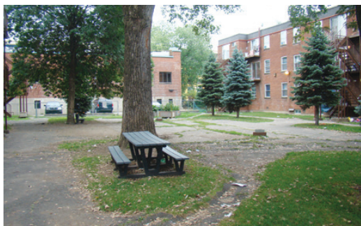
📍 L'aménagement réalisé aux habitations Delorimier.