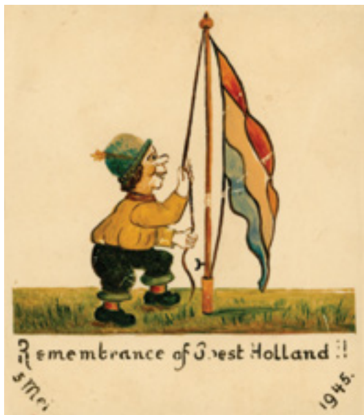
Plaque commémorative de la libération des Pays-Bas de 1945.