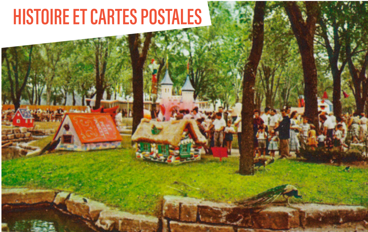
Source : Collection Jean-Pierre Bourbeau ; Ed. : Souvenir Agencies, Montréal. Photo : Service des parcs de la Ville de Montréal