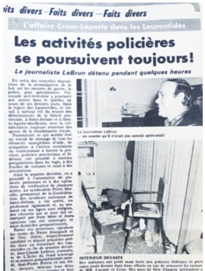
L'édition du 21 octobre de L'Écho du Nord rapporte l'arrestation d'un de ses journalistes, Jean-Claude LeBrun.