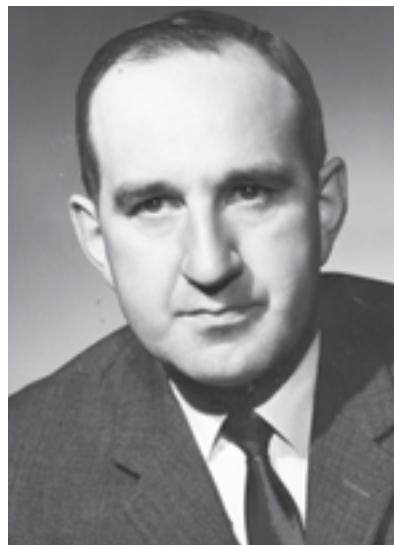
Le ministre du Travail et Vice-premier ministre du Québec, Pierre Laporte, enlevé le 10 octobre 1970 et retrouvé sans vie une semaine plus tard.

Saint-Lambert, vient ajouter au climat d'angoisse que le jeune Premier ministre Robert Bourassa, élu il y a cinq mois à peine, tente de résorber tant bien que mal.