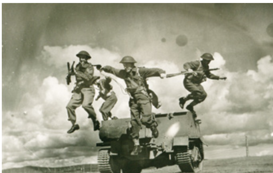
Soldats durant un entraînement militaire, entre 1941 et 1945.