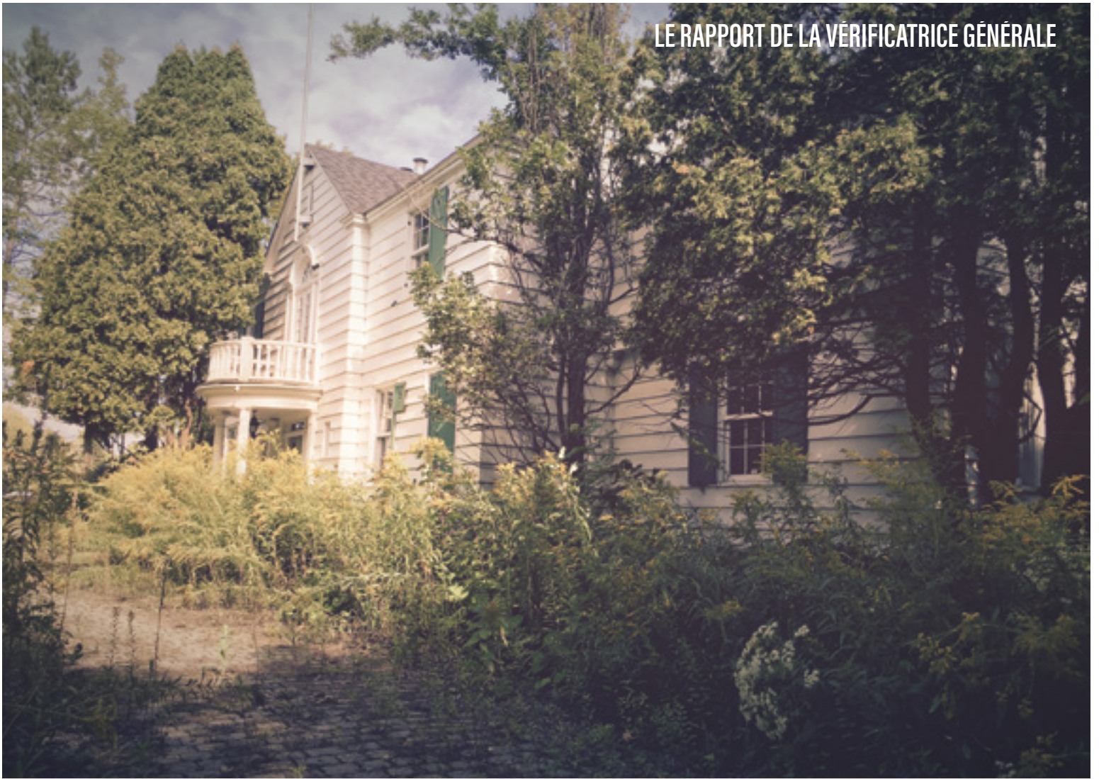
Bâtiment patrimonial abandonné [inoccupé] sur la rue Rolland à Saint-Jérôme, inscrit dans l'inventaire des bâtiments patrimoniaux de la Ville. En attendant une vocation, va-t-il continuer à se détériorer ?