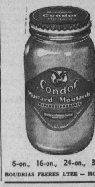
6-on, 16-on, 24-on, 30-on. BOUDRIAS FRERES LITEE - MONTREAL