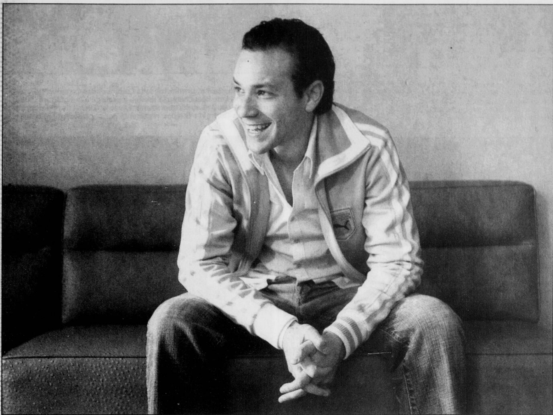
Le chanteur Adam Cohen ne veut pas se contenter d'un petit succès. Il veut gagner vraiment le coeur des Québécois.