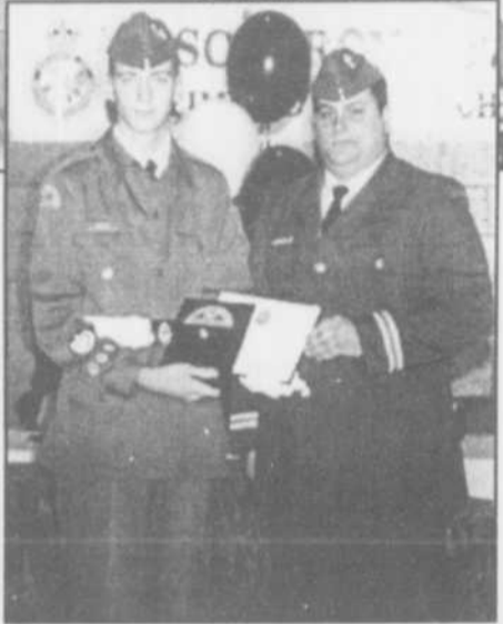
La "Collation des grades" de l'escadron 757 Optimiste Mascouche avait lieu le 4 décembre dernier au centre René-Lévesque. L'enthousiasme et la fierté se lisaient dans les yeux des cadets et des parents.

Au centre René-Lévesque, le samedi 4 décembre se tenait la "Collation des grades" de l'escadron 757 Optimiste Mascouche.