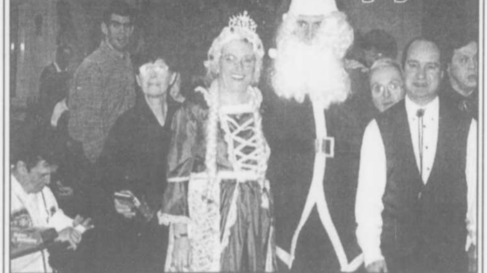
Le dépouillement d'arbre de Noël que l'organisme Je Vis et j'en ai le droit a tenu en décembre dernier fut un grand succès pour les 120 bénéficiaires grâce à la générosité de nombreux commanditaires.