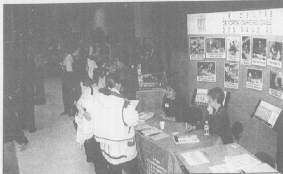
Depuis plusieurs années, plus d'un millier d'élèves du secondaire de la commission scolaire et de nombreux adultes se rendent à l'école Armand-Corbeil pour sa traditionnelle "Information scolaire". Elle a lieu le soir du 26 janvier cette année.

C'est le mercredi 26 janvier que l'école secondaire Armand-Corbeil accueillera sa traditionnelle soirée "Information scolaire". Elle se tient de 19h à 21h30 dans les locaux de l'institution située au 795 boulevard J.F.Kennedy à Terrebonne.