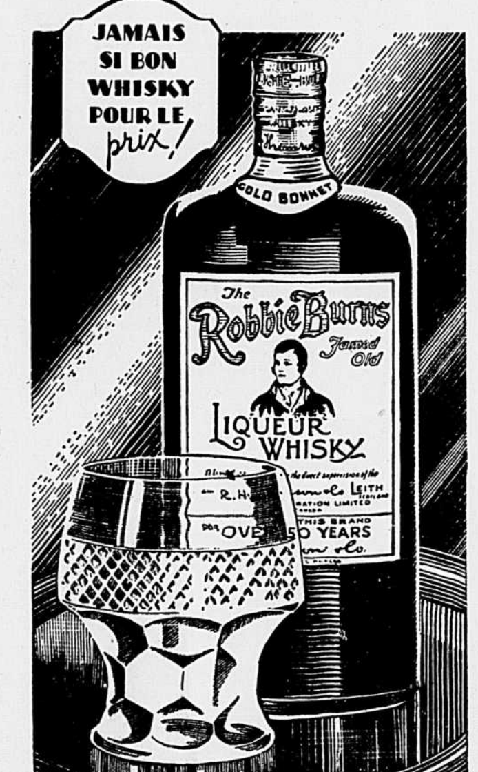
FLACON DE 13 ONCES BOUTEILLE DE 25 ONCES

Consultez la Pépinière BÉDARD DE JOLIETTE