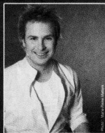
YANNICK NÉZET-SÉGUIN DIRECTEUR ARTISTIQUE ORCHESTRE MÉTROPOLITAIN DU GRAND MONTRÉAL ET O. P. DE ROTTERDAM