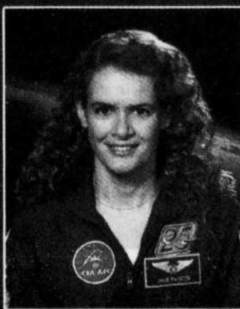
JULIE PAYETTE ASTRONAUTE, AGENCE SPATIALE CANADIENNE