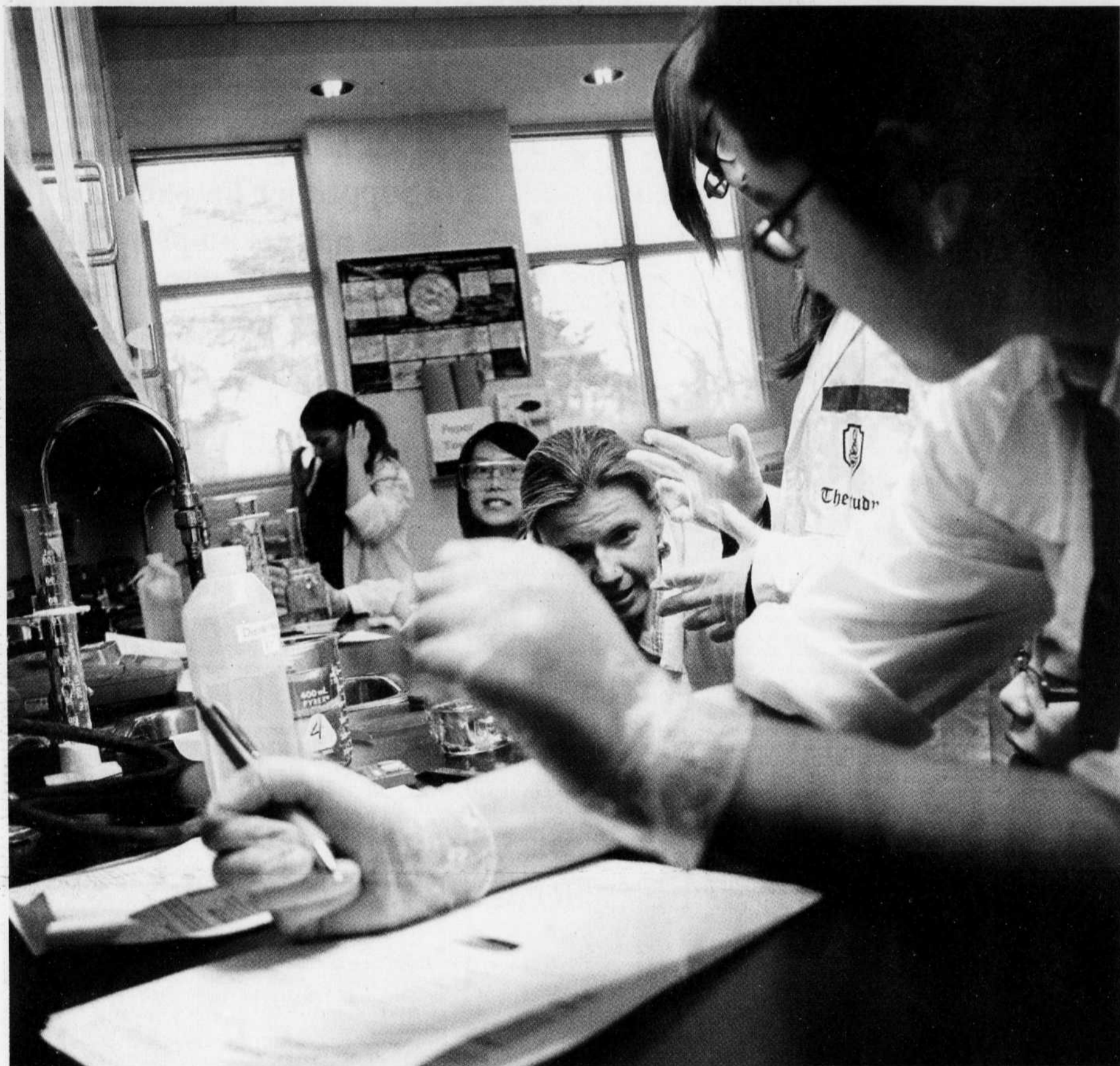
Une enseignante de l'école The Study, entourée de ses élèves