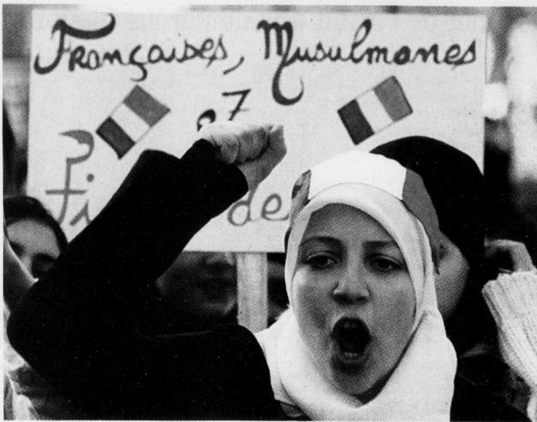
En France, la loi interdit le port ostensible de signes d'appartenance religieuse à l'école publique, ce qui a incité certaines musulmanes à descendre dans la rue pour protester contre cette politique.