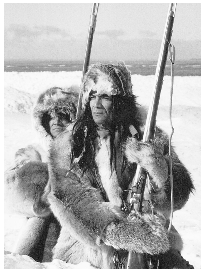
Une scène de Le Canada : une histoire populaire , qu'on pourra voir à Radio-Canada à compter du 22 octobre.

Le résultat est évidemment assez loin du téléroman ; beaucoup plus près de la pédagogie que du pur divertissement. On ne s'étonnera pas d'apprendre que des guides d'accompagnement seront faits pour les professeurs qui souhaiteraient s'en servir en classe. Ce qui ne rend pas le produit final inintéressant. L'épisode 4, présenté aux journalistes hier, nous apprend entre autres que Wolfe y est finalement pour bien peu dans le gain de la bataille des plaines et que Franklin était très antipathique à la réalité canadienne. Plusieurs découvriront aussi que la guerre bactériologique n'est pas un apanage du 20 e siècle ; les Britanniques ont conta-