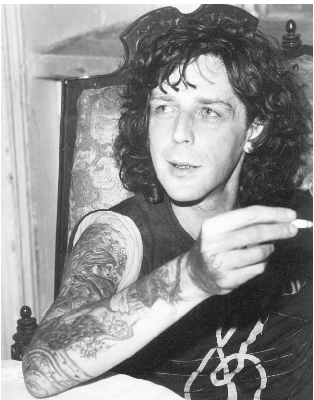
Denis Vanier en 1984.