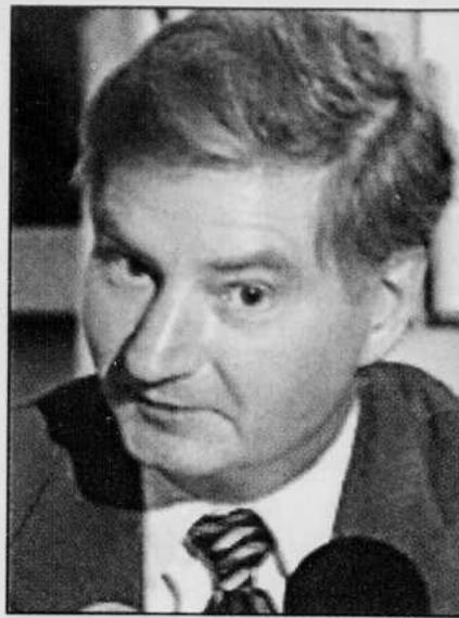
Le ministre de la Sécurité publique, Serge Ménard, trouve inadmissible que des policiers utilisent à des fins syndicales l'autorité que leur confèrent leur uniforme et leur arme de service.

en cours menée conjointement avec des policiers municipaux de Drummondville permettra de déterminer «quelles actions seront entreprises à l'endroit des policiers relativement aux bousculades qui sont survenues au cours de la manifestation».