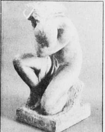
La Peine, d'Alfred Laliberté.

Le défenseur Chris Chelios a subi une arthroscopie qui n'a rien décelé d'anormal mais il ratera à tout le moins la fin de la saison. Page 15