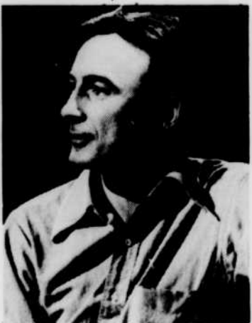
Ginette Reno Yvon Deschamps