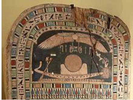
La barque solaire Wikipédia