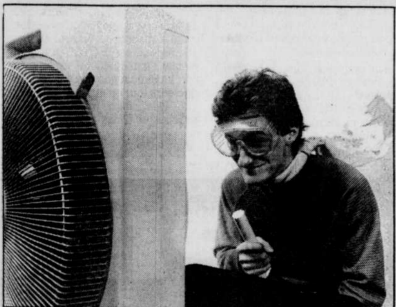
Les gens ont littéralement sauté sur tout ce qui avait un moteur, une hélice et poussait de l'air.

La congélation des fraises entières est sans doute la meilleure manière de conserver des petits fruits frais pour l'hiver. Placer, en un seul rang, sur une tôle à biscuits. Faire pré-congeler 30 minutes. Lorsqu'elles sont bien fermes, les mettre dans des sacs à congélation. Ainsi, elles garderont leur forme. Avant de servir, les faire décongeler partiellement au frigo.