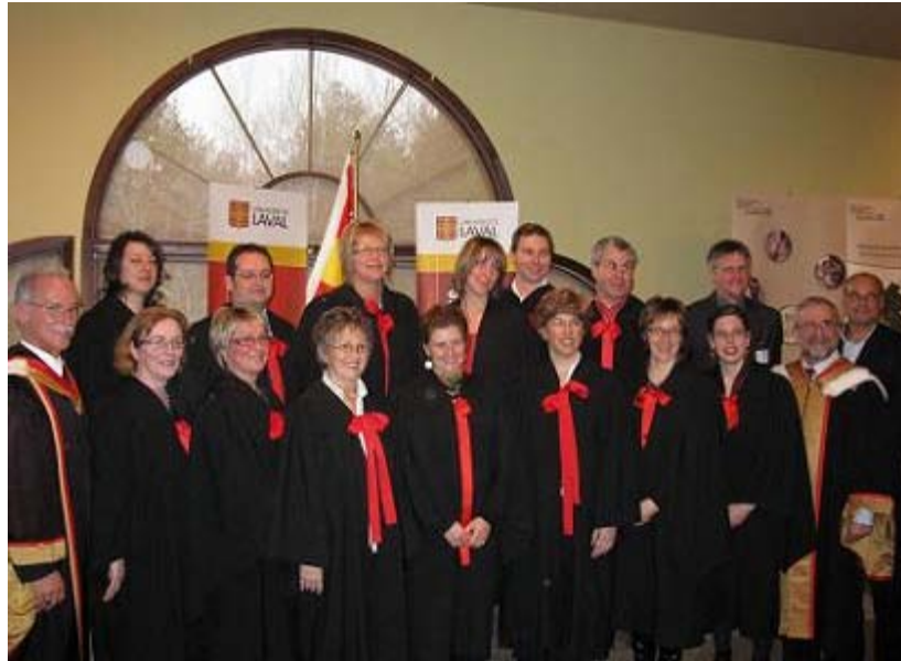
microprogramme 2e cycle groupe 5