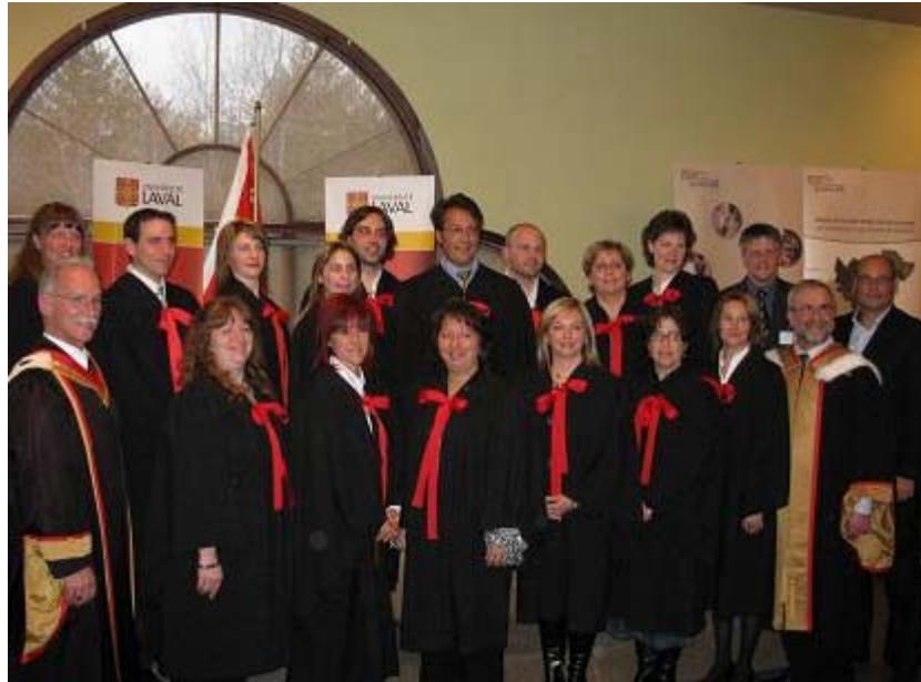
diplôme 2e cycle groupe 3

« Aujourd'hui, un cheminement se termine mais pour certains d'entre-nous, il se poursuit. Nous pouvons être fiers. Applaudissons-nous! Nous le méritons! Pour nous, ces cours furent une expérience unique d'apprentissage, de connaissances et de compréhension, d'analyse de soi et de l'organisation, d'alliance, de plaisir et d'amitié », a-t-il affirmé.