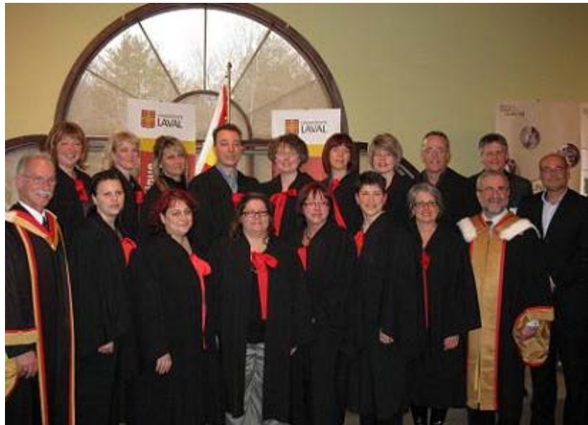
microprogramme 1er cycle groupe 3

Dans le cadre du Programme de relève des cadres dans le réseau de la santé et des services sociaux de la Mauricie et du Centre-du-Québec, l'Agence de la santé et des services sociaux de la Mauricie et du Centre-du-Québec ainsi que l'Université Laval sont fiers de présenter quatre cohortes de finissants. Ces derniers se sont vu attribuer attestations, certificats et diplômes en gestion et développement des organisations de 1er et 2e cycle à 86 professionnels de la santé et des services sociaux de la région. C'est le 9 avril dernier, au Club de golf Les Vieilles Forges, dans une formule 5 à 7, qu'étaient rassemblés finissants, employeurs ainsi que représentants de l'Agence et de l'Université afin de célébrer ces efforts et cette belle réussite.