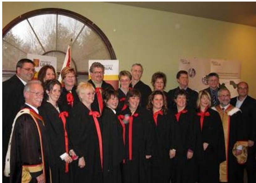
certificat 1er cycle groupe 2