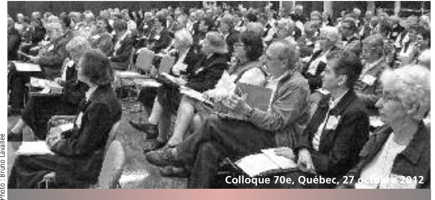
Colloque 70e, Québec, 27 octobre 2012

Quel que soit le nom porté dans une Famille: personnes associées, amies ou affiliées... le CLEFS ne prétend pas parler au nom de toutes les personnes laïques engagées dans une famille spirituelle (PLEFS). Il ne prétend pas non plus que tout le monde devrait y adhérer. Il veut seulement contribuer, humblement, à la réflexion et travaille à la croissance de ce beau don de l'Esprit – à l'Église et aux instituts – que sont les PLEFS