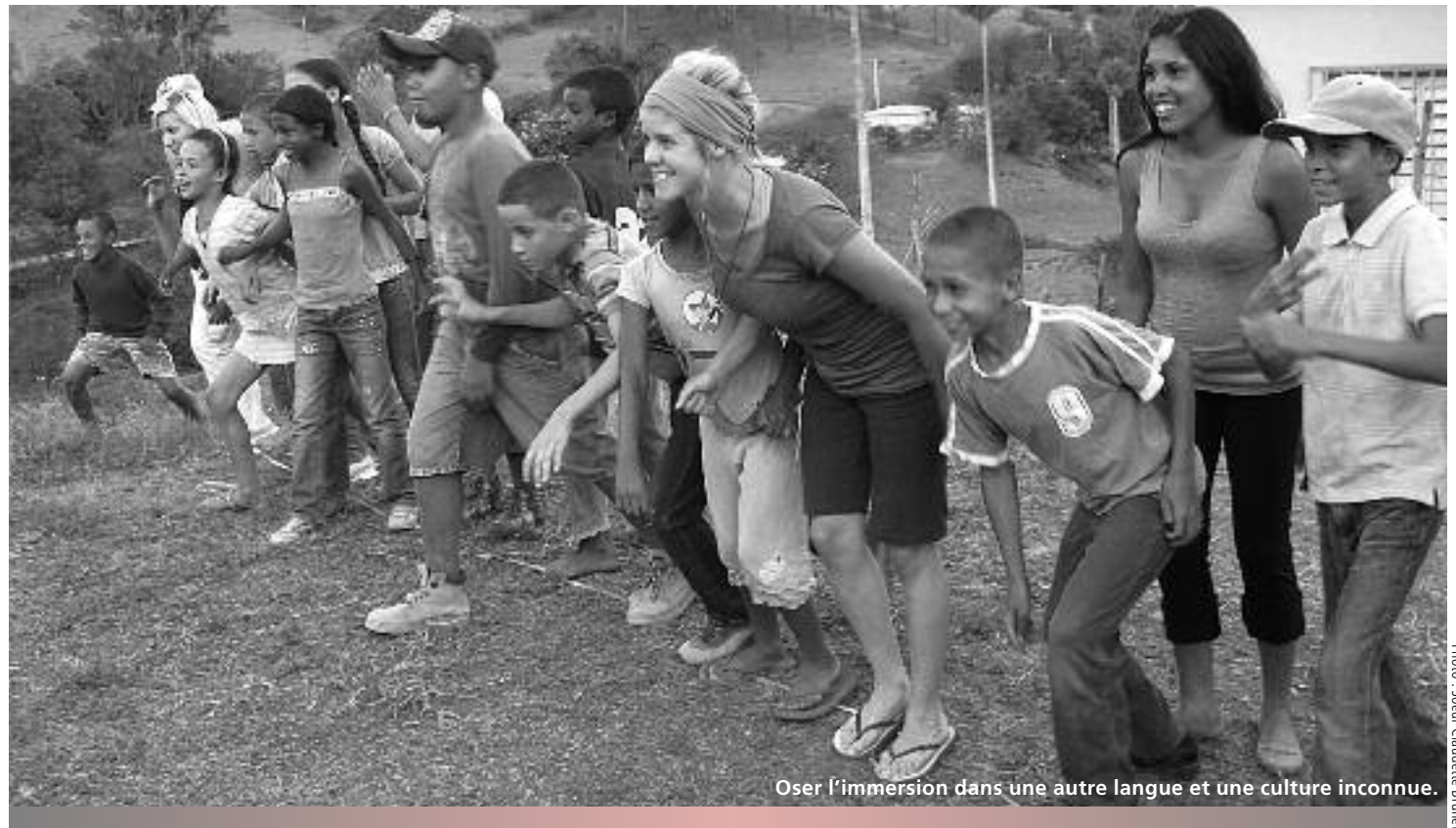
Oser l'immersion dans une autre langue et une culture inconnue.