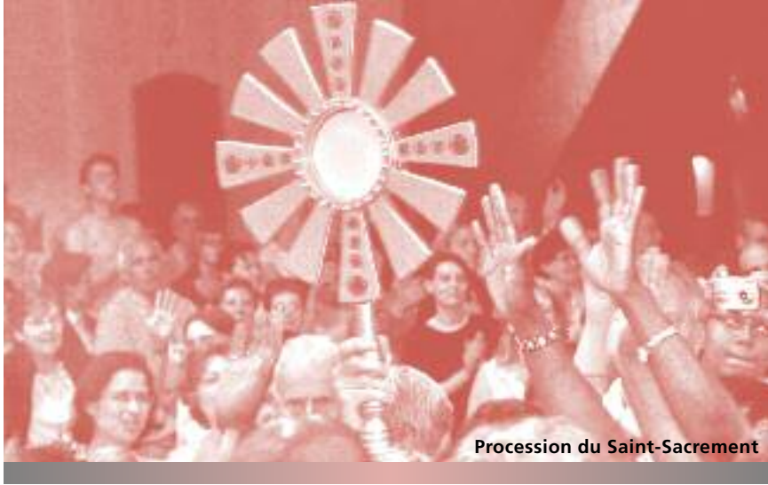
Procession du Saint-Sacrement

sont moins développées, ce qui s'explique, entre autres choses, par le fait que dans la plupart des communautés, le fondateur est vivant et actif ou la fondation est récente et a encore un minimum de structures.