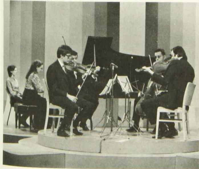
Le Quatuor Orford