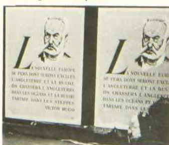
Le Chagrin et la pitié