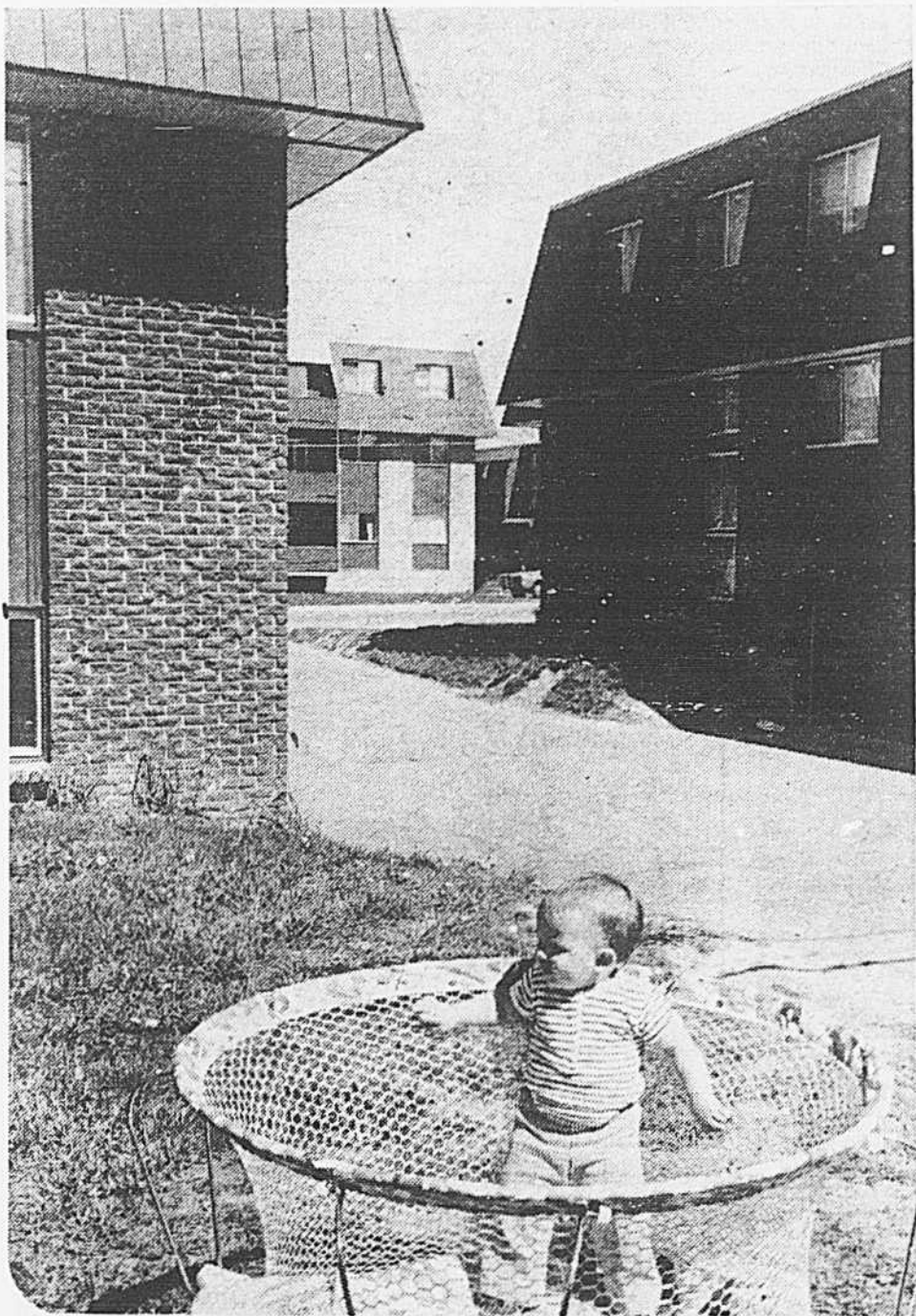
Des immeubles qui répondent aux normes strictement minimales du Code national du bâtiment...

Dans les municipalités des Basses Laurentides les cons-