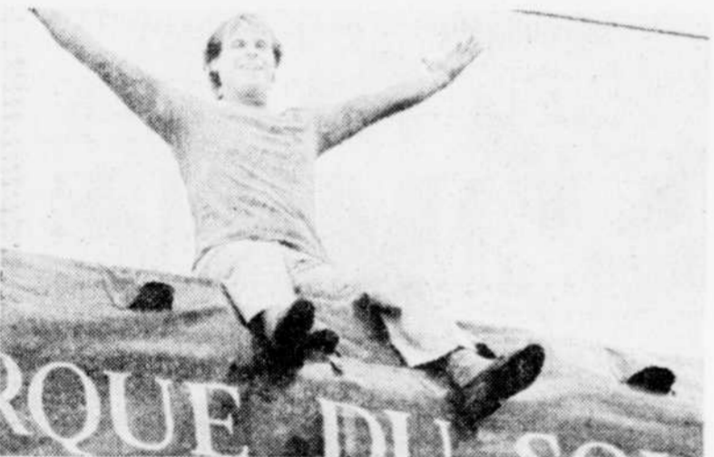
Guy Laliberté: un administrateur qui crache le feu.

◆ VANCOUVER — Le Cirque du Soleil a connu au cours de 1984 et 1985 une évolution spectaculaire et son directeur général, Guy Laliberté, parle de cette troisième saison comme d'une année de consolidation, même si elle commence en lion par un séjour de près d'un mois sur la côte Ouest, d'abord au Children's Festival et maintenant pour l'animation de quelques-unes des scènes du pavillon du Canada à EXPO 86, jusqu'au 11 mai.