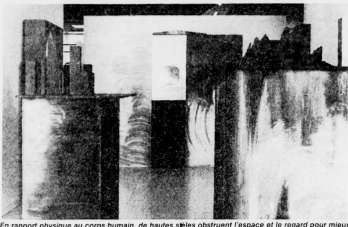
En rapport physique au corps humain, de hautes stèles obstruent l'espace et le regard pour mieux inciter à les contourner: c'est le jeu du parcours proposé par l'oeuvre de Jocelyne Allouche.

L'artiste précise: "L'idée de fragmentation est importante, car elle permet de proposer plusieurs sens possibles à l'intérieur d'une structure globale, une structure que je crois lisible en dépit de l'hétérogénéité des éléments et des traitements. Cela implique cependant que le visiteur fasse une lecture lente de mon oeuvre, car je ne travaille pas avec l'évidence..."