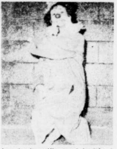
Les tous-petits sont invités à rencontrer Pivoine, le clown-mime, à la Bibliothèque Gabrielle-Roy.

Le maître du jeu (5) Américain 1984. Drame fantastique réalisé par Rosemarie Turko. Int: Jeffrey Byron, Richard Moll. Un jeune spécialiste en informatique a mis au point un ordinateur personnel doté de possibilités surprenantes. Au cours d'un cauchemar, il rencontre un être maléfique qui veut éprou-