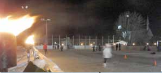
sauf équipe gagnante