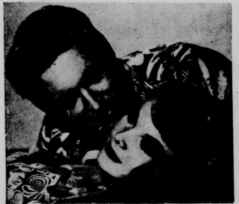
Allan Jones et Jane Frazer, étoiles du film "Rhythm of The Islands", à l'affiche du Théâtre Impérial, jeudi-vendredi-samedi, 30 septembre, 1er et 2 octobre.