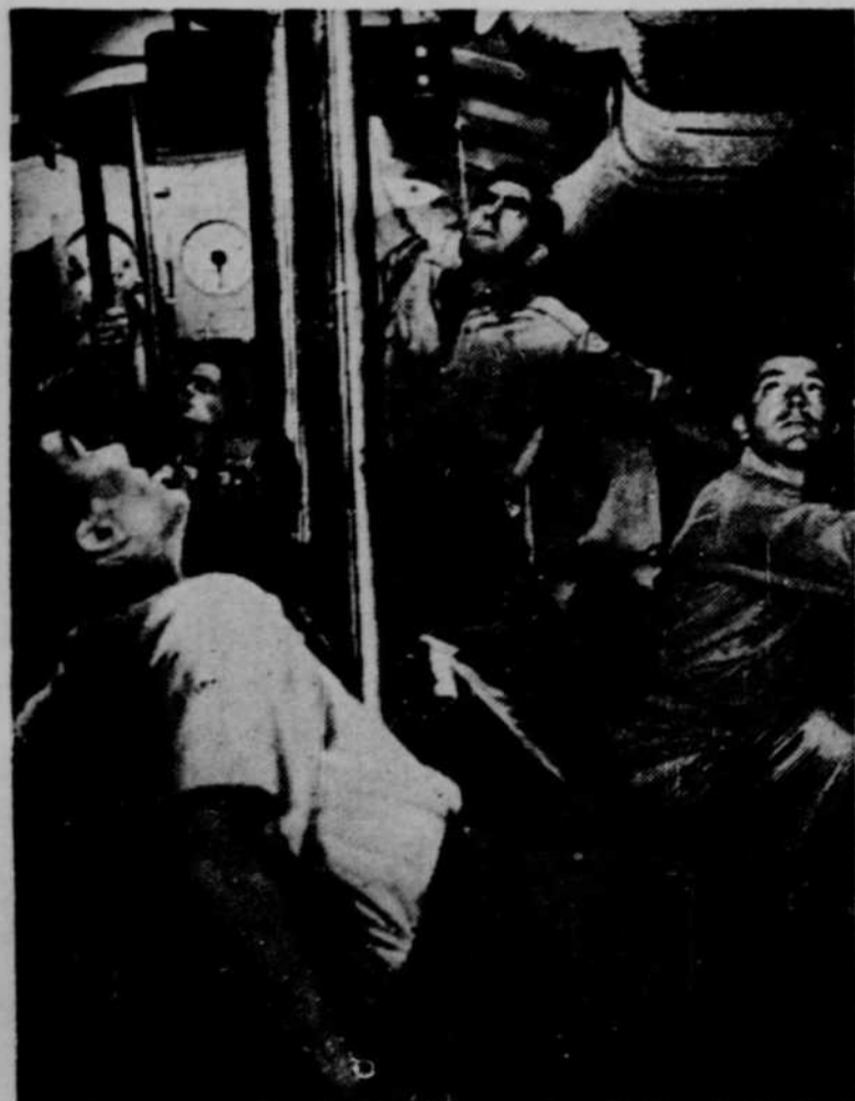
Tyrone Power, dans une scène du film en couleurs "Crash Dive", qui sera à l'affiche du Cartier, pour 4 jours, commençant dimanche, 3 octobre.