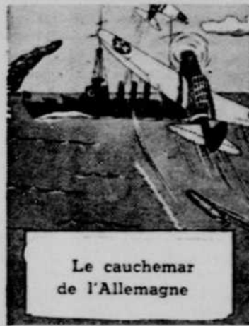
Le cauchemar de l'Allemagne