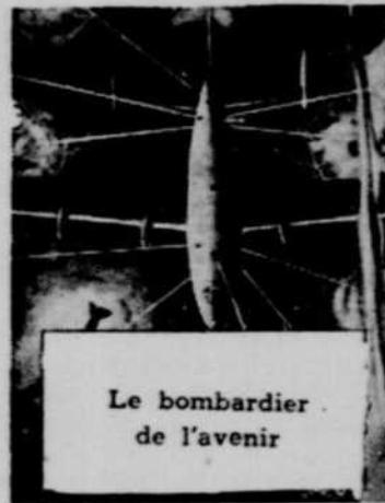
Le bombardier de l'avenir

Jeudi - Vendredi - Samedi 30 Sept., 1 - 2 Octobre MATINEE SAMEDI