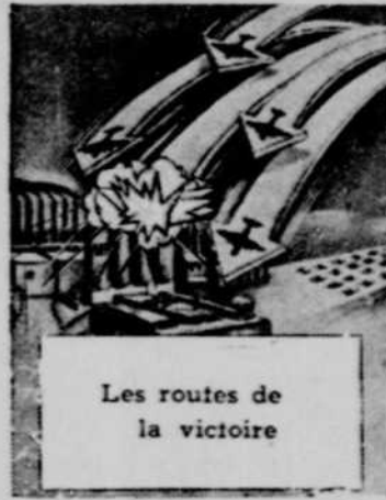
Les routes de la victoire

UN FILM INTERESSANT... CAPTIVANT... et INSTRUCTIF.