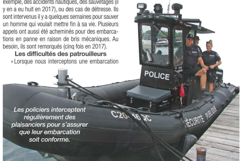
Les policiers interceptent régulièrement des plaisanciers pour s'assurer que leur embarcation soit conforme.