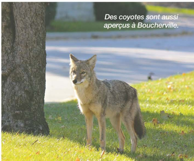
Des coyotes sont aussi aperçus à Boucherville.

À noter aussi, sur un réseau social de Boucherville, une citoyenne a récemment signalé la présence d'un lynx dans le secteur du Boisé.