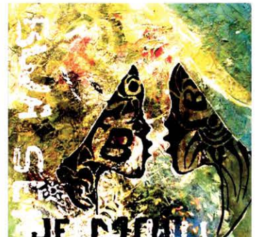
Vitrine 20 – Léonel Jules